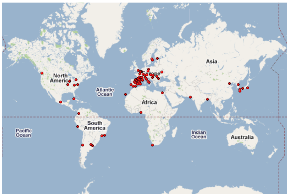
Mapa amb la distribució de les revistes originals segons la ciutat d'origen