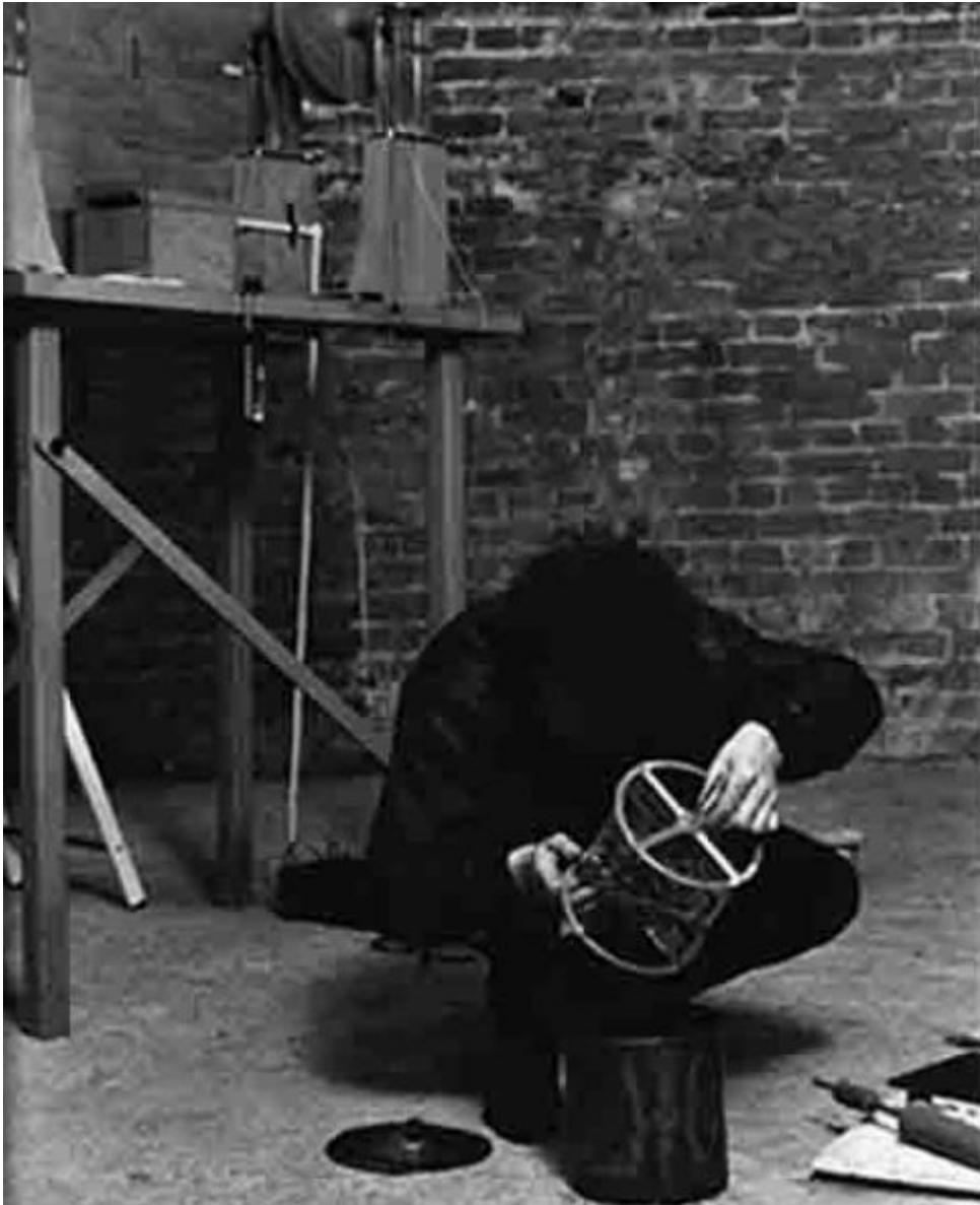
Sibus reconstruint un dels aparells científics històrics.

avui dia, hi havia pocs científics professionals. Ara bé, en Joule era fill d'un ric fabricant de cervesa de Manchester. En el seu diari, podem llegir: "He treballat 8 hores a la cerveseria del meu pare i, al matí i al vespre, he fet alguns experiments". Llavors vaig pensar que si va treballar durant gairebé 20 anys, 8 hores al dia en una fàbrica de cervesa, calia saber què significava ser fabricant de cervesa a la dècada de 1840 a Manchester. Així que vaig buscar en un munt de material sobre la rutina diària d'un fabricant de cervesa. I vaig trobar que els veritables experts en termòmetres i termometria durant aquella època eren els fabricants de cervesa! Just en aquell moment estaven aprenent com produir cervesa a gran escala, fet que requereix una gran quantitat de coneixements sobre la temperatura necessària per a la fermentació. A més, per recollir impostos, el govern volia saber amb precisió la quantitat d'alcohol que es produïa, ja que com més alcohol més recaptació. Per tant, la vida quotidiana dels cervesers, com en Joule, consistia en prendre mesures de la temperatura del contenidor de cervesa durant diferents moments de la seva producció.