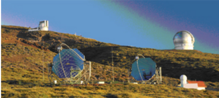
Els dos telescopis MAGIC, situats al Roque de los Muchachos de l'illa Canària de La Palma.

12/2011 - Física. La matèria fosca és el component majoritari de l'Univers: hi ha quatre vegades més matèria fosca que matèria normal. Tot i així, és una gran desconeguda: no emet ni absorbeix la llum directament i només es veu afectada per la força de la gravetat. Ara bé, quan dues partícules de matèria fosca col·lisionen, es poden aniquilar i generar raigs gamma, que són fotons amb milions de vegades més energia que la llum visible, i que poden ser detectats per instruments com el telescopi MAGIC, un experiment europeu situat a l'illa canària de La Palma. En aquest article, en què han participat investigadors de la UAB, es presenta la cerca de matèria fosca de MAGIC en l'objecte que es creu que és el més dominat per la matèria fosca del firmament i que es troba en els veïnatsges de la nostra pròpia galàxia: una galàxia satèl·lit de la Via Làctia anomenada Segue 1.