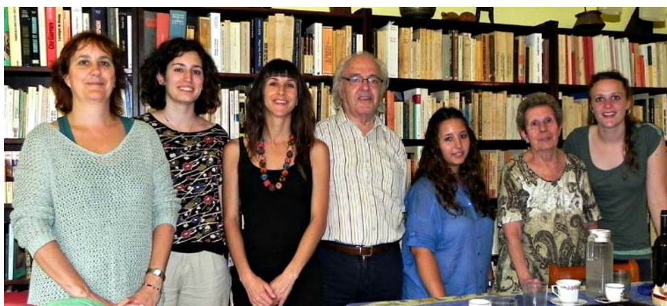
Fotografia de dreta a esquerra:

Moltes gràcies pel seu temps i la seva hospitalitat! Ha estat un plaer.