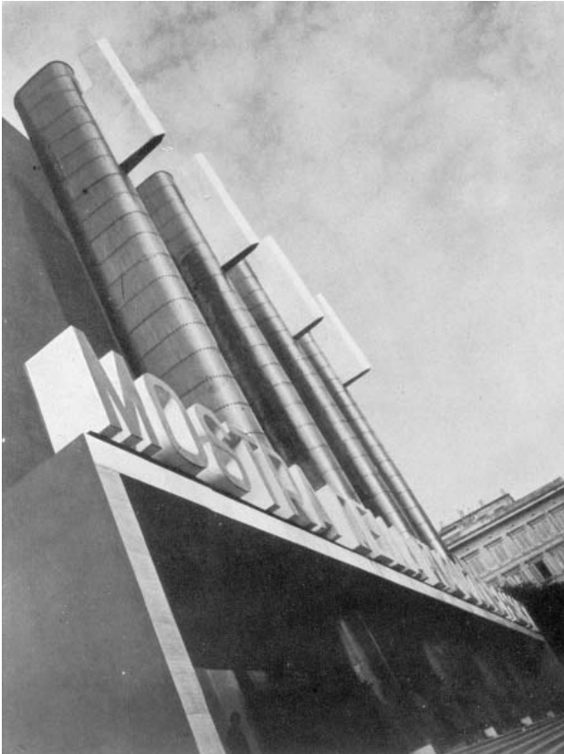
Figura 1. Fachada de la Muestra de la Revolución Fascista. Los cuatro elementos verticales realizados en acero y revestidos con láminas de cobre simbolizan el fasciolittorio con sus hachas. Fuente: Mostra della Rivoluzione Fascista in Roma. Rassegna di Architettura. 1933; 7-8: 320-321.

«desinfección» operada tras eliminar al «bacilo socialista y comunista» 29 . Así y tras exaltar que la nación había sido salvada de «elementos subversivos», el mensaje instaba a las masas a ejercer una constante vigilancia para proteger las instituciones políticas, algo que en términos biopolíticos equivalía a preservar el estado de «inmunidad» alcanzado 30 .