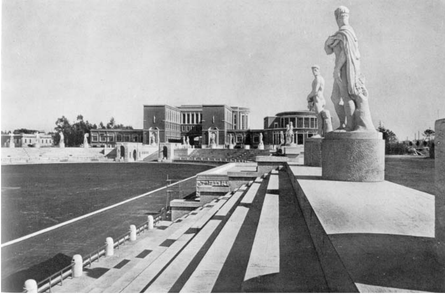
Figura 4. Stadio dei Marmi . Fuente: Il «Foro Mussolini» in Roma. Rassegna di Architettura . 1933; 7-8: 324-328.