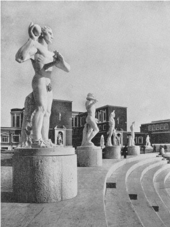
Figura 5. Estatuas del Stadio dei Marmi .

La victoria militar aceleró el establecimiento de una legislación racial, que trascendió largamente la aspiración planteada en 1919 por Giuffrida-Ruggeri en el sentido de impedir uniones matrimoniales entre italianos y africanos. Racismo y ciudadanía se conjugaban en un sistema de premios y castigos asociados a la custodia de una entidad que debía quedar a salvo de aquello que podía provocar su decaimiento. La defensa de la romanidad requería así de una ciudadanía restrictiva, un régimen de apartheid ,