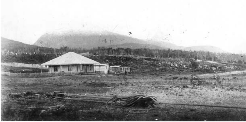
Figura 6. Presidio de Ushuaia, año 1898. Fuente: Archivo Central Salesiano. Caja 201: Indígenas . Testimonios de malos tratos. Serie de notas del P. Lorenzo Mazza sobre indígenas del Sur Patagónico. «90 años de acción salesiana». Los indios de la Patagonia hacia 1879.

Aunque no conforme Godoy con las aptitudes de los nuevos colonos, el penal alcanzaba objetivos inmediatos. Por un lado solucionar el problema demográfico acuciante del territorio; por el otro, ponía freno a la escoria citadina al enviarla al confín del mundo. Respecto al incremento de población, según el Segundo Censo Nacional del año 1895 Ushuaia tenía 39 casas, la misma cantidad de familias, con un total de 131 habitantes no indígenas. En el lustro 1890-1894, Tierra del Fuego sólo recibió 26 inmigrantes sobre un total de 137.893 internados y colocados oficialmente en el país por la Dirección de Inmigración 42 .