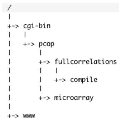
Figura 1: Esquema de la arquitectura del servidor público

En ambos servidores existe la misma arquitectura de directorios (podemos verla en la Fig. 1): Encontramos replicada en el servidor de pruebas la arquitectura del servidor público.