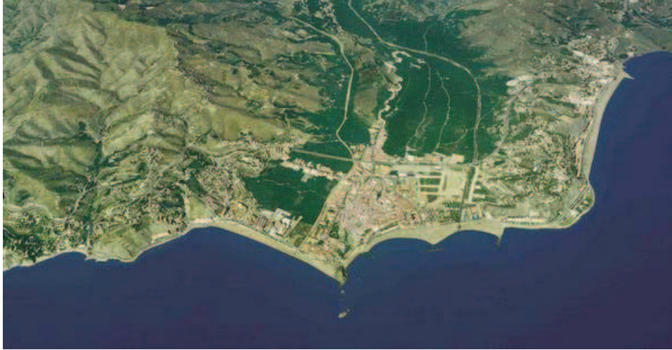
Figura 1.- (Fotografía aérea de Almuñécar) 1

Para el período que nos toca investigar, tanto para la Alta como para la Baja Edad Media, contamos con abundante información escrita de las fuentes árabes y sobre todo de las fuentes castellanas generadas tras la conquista cristiana del Reino Nazarí.