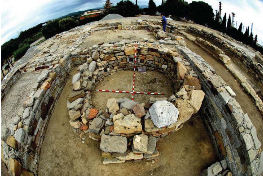
Figura 4.- Vista general del atrio.

la domus, exceptuando algunos trabajos puntuales como el realizado por la Dra. Roldán relativo a las técnicas constructivas para su tesis doctoral en los años '90, y publicado en Monografías de Arquitectura Romana (Roldán, 1992).