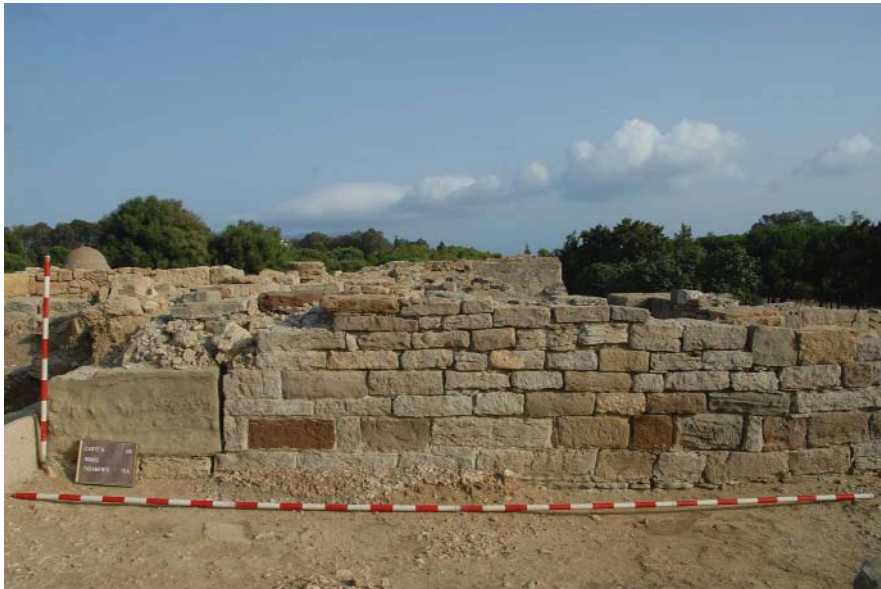
Figura 5.-Alzado de uno de los muros del fauces.

La aplicación de la fotogrametría supone un método de reconstrucción tridimensional muy significativo para la realización de estudios arqueoarquitectónicos, ya que permite un nuevo enfoque para el estudio de los paramentos y sus técnicas constructivas. Estos trabajos –actualmente en ejecución– serán de gran utilidad a la hora de plantear hipótesis de reconstrucción del edificio objeto de estudio.