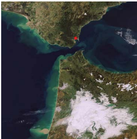
Figura 1.- Situación de la ciudad púnicoromana de Carteia en el Estrecho de Gibraltar.

La ciudad de Carteia se sitúa en la Bahía de Gibraltar, en la zona más meridional de la Península Ibérica (Fig.1). Su situación geográfica posee una extrema relevancia, ya que no sólo ocupa el centro de la propia bahía, sino que se emplaza en el propio Estrecho de Gibraltar, conocido dentro del imaginario griego como las Columnas de Hércules (Jiménez, 2009).