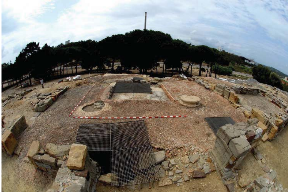
Figura 3.- Horno tardío en uno de los cubicula.

cubicula , mientras que en la parte trasera, hoy desaparecida, pudo localizarse el tablinium , alineado en el eje entrada- atrium , aunque se trata de una mera hipótesis.