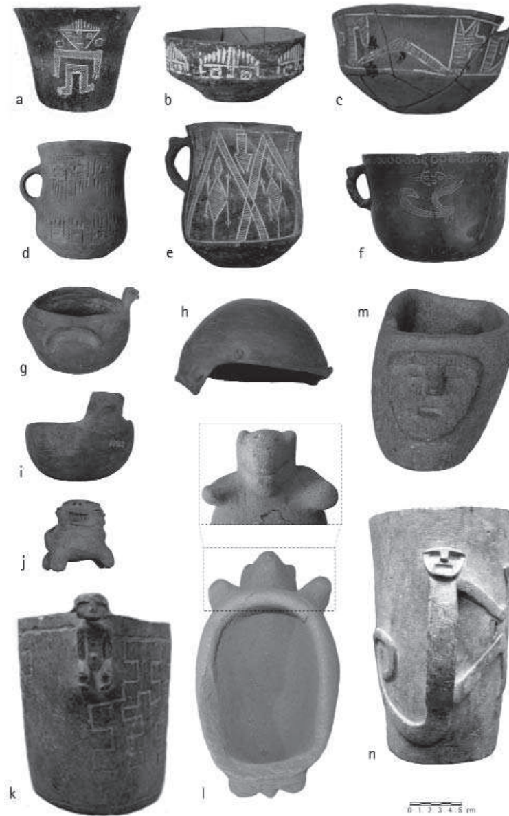
Figura 2.- Algunos objetos cerámicos (a-j) y líticos (k-n) del ajuar que marcan una diferencia cualitativa entre sepulcros de adultos y subadultos. a) Figuras incisas antropomorfas de cuerpo completo, CMB 10827. b) y d) Figuras incisas de cabezas humanas, CMB 10781 (b) y 10974 (d). c) y e-f) Figuras incisas zoomorfas: camélidos, CMB 10980 (c); "saurios", CMB 10857 (e); "simios", CMB 10855 (f). g-j) Vasijas modeladas zoomorfas: CMB 10986 (g); cuenco en forma de quirquincho, CMB 10975 (h); CMB 10962 (i) y 10957 (j). k-n) Objetos de piedra con decoración esculpida: vaso con figura humana, CMB 10977 (k); mortero zoomorfo, CMB 10880 (l); mortero con figura de cara, CMB 10777 (m); vaso con figura de "simio", CMB 10844 (n).