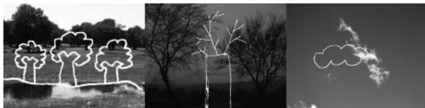
Figura 2. Imatges extretes del DVD de dibuix

Les imatges de la figura 2 prenen un significat més interessant en el context de l'àrea si les acompanya un text que expliqui per què hi són. Aquest cas és molt il·lustratiu de la dificultat que, en general, hi ha a l'hora de dibuixar. Normalment se surt del pas amb imatges estereotipades, ignorant la possibilitat d'observar; cal, doncs, aprendre a mirar.