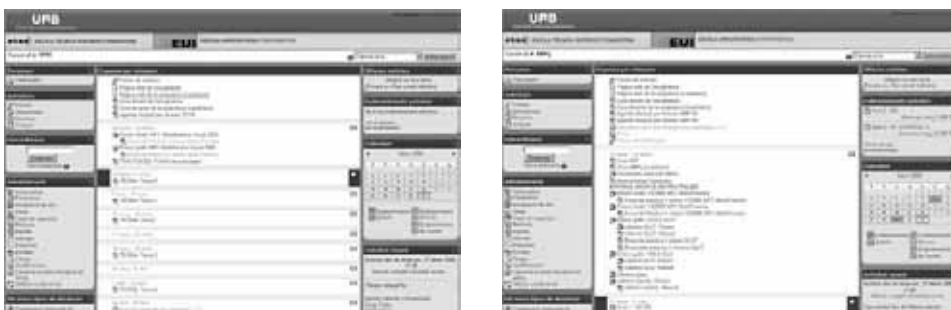
Figura 2. Materials i activitats en la plataforma LMS Caront per als dos itineraris de l'assignatura: TPPE (esquerra) i ABP (dreta)

Com es pot veure, aquest doble itinerari no representa una major càrrega docent presencial del professor respecte l'anterior organització docent. Sí que significa una mica més de treball en la tutorització i el seguiment dels grups d'ABP, compensat amb el fet que hi ha menys exàmens per corregir, ja que els estudiants de l'itinerari ABP no fan l'examen. En la figura 2 es mostren els materials i les activitats per a ambdós itineraris en Caront.