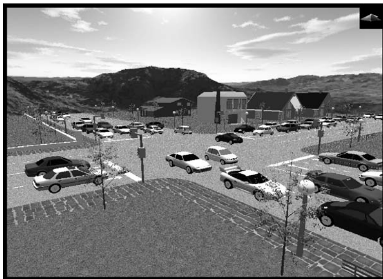
Figura 4. Imatge de l'aplicació proposada pels estudiants del projecte «Creuament»