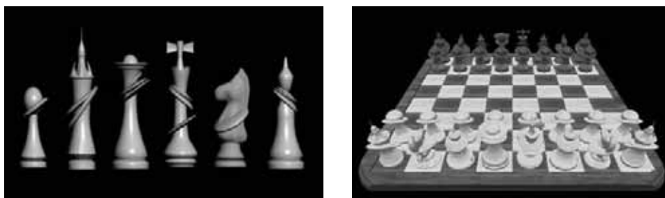
Figura 3. Disseny de les peces d'escacs. Tauler d'un grup d'estudiants ABP per al projecte 1

En la figura 3 es mostra el treball d'un grup ABP del curs 2005-2006. A part d'assolir els objectius plantejats, es va fer un disseny personalitzat de les peces. Per evitar les col·lisions en el moviment, s'enfonsa la peça del quadre i es fa emergir en l'altre quadre.