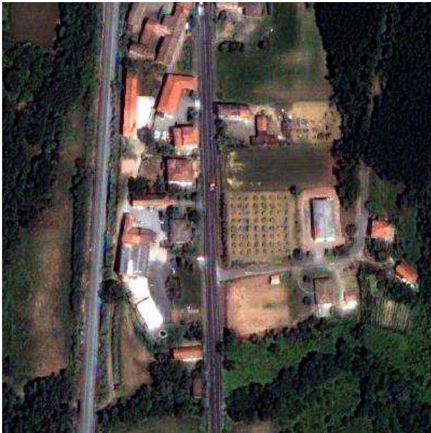
Figura 4. Imatge fusionada obtinguda pel mètode WiSpeR definit pels autors en aquest treball.