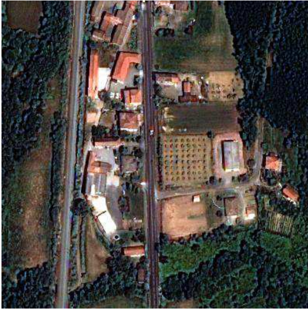
Figura 3. Imatge fusionada obtinguda per un mètode clàssic basat en la descomposició IHS.