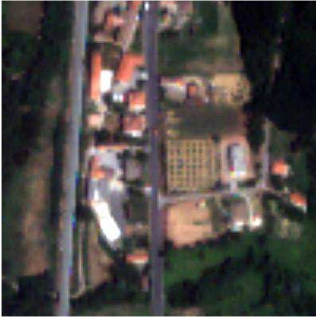
Figura 1. Imatge en color de baixa resolució captada per un primer sensor.