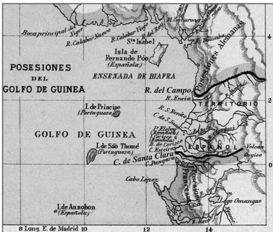
Mapa 1. Espacio costero comprendido entre el río Campo y el cabo Santa Clara, reivindicado por España en la región del Muni conforme a la propuesta realizada por el gobernador José de Barrasa.

Así, el primer episodio se dio cuando el comisario superior de Libreville dirigió dos comunicaciones de protesta a De Barrasa. La primera contra el