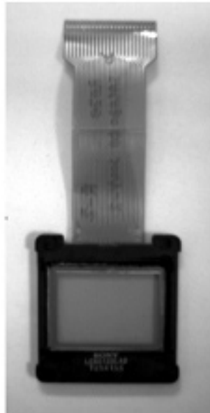
Figura 1. Imatge d'una pantalla LCD.

Les pantalles de cristall líquid són un element molt comú com a visualitzador (display) en els dispositius actuals de l'electrònica de consum. Investigadors del Departament de Física de la UAB, de la Universitat Miguel Hernández d'Elx i de la Universitat d'Alacant, han publicat un article on demostren com es poden modelitzar les reflexions múltiples que es produeixen a l'interior de les pantalles LCD i quin és l'efecte sobre la capacitat moduladora.