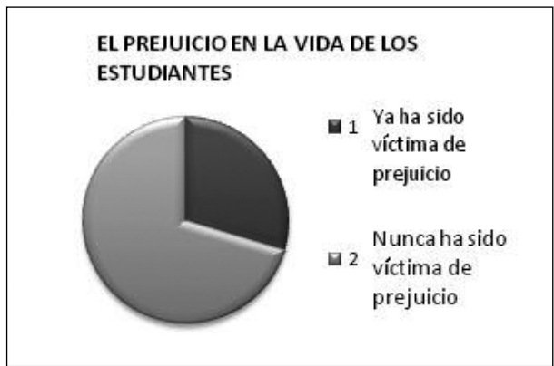
Figura 3 Víctimas del prejuicio (Total = 27).

Según Pereira (2002), es necesario que se fije la identidad racial como construcción histórica y no como dato biológico. En este sentido, lo que define una raza son las interpretaciones socioculturales dadas las características fenotípicas. Muchos alumnos parecen saber quién es «negro» y qué interpretaciones socioculturales pueden darse en un país veladamente racista: