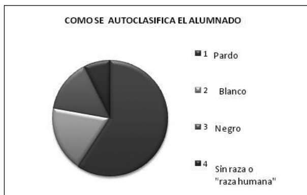
Figura 1 Datos referentes a la autoclasificación racial (Total = 27).

Una minoría de estudiantes se consideró sin raza o pertenecientes a la raza humana, justificando que no podrían simplemente incluirse en ninguna de las categorías de clasificación, puesto que existían varias clases de personas blancas, negras y pardas. En las clases que hubo