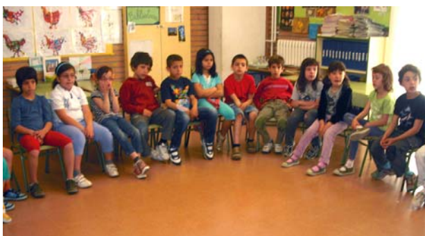
Quadre 1. Respostes dels infants a la pregunta "què en sabem de...?"

Hem comprovat que la pregunta "Què sabeu de...?", és molt general, poc significativa i poc productiva. En aquest moment els infants encara no s'han formulat cap qüestió i el que fan es intentar recordar què han llegit o vist a la TV, però el que