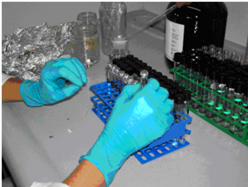
Anàlisi dels lípids d'arqueobacteris continguts als sediments, amb els quals es reconstrueixen les temperatures ambientals del passat.

10/2007 - Geologia . L'anàlisi dels arqueobacteris, els organismes més antics que es coneixen al nostre planeta, ens poden aportar moltes dades sobre les temperatures dels mars i dels llacs fa milers d'anys i ajudar a reconstruir la història climàtica de la Terra. Investigadors de l'ICTA (Institut de Ciència i Tecnologia Ambientals) han millorat el mètode existent fins ara per analitzar-los i han aconseguit reduir el temps d'anàlisi per mostra d'1 hora a 8 minuts.