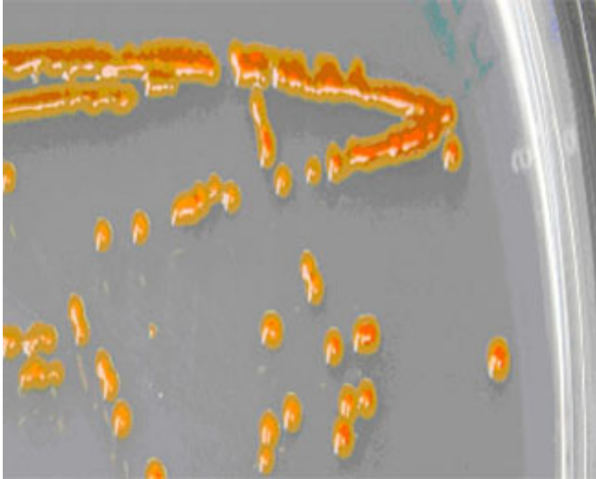
Colònies de Polaribacter sp. MED152 creixent en placa

Un nou pas en l'estudi de la genòmica permetrà entendre una mica més la vida cel·lular i molecular present als oceans. En aquest cas, l'anàlisi s'ha centrat en el bacteri Polaribacter sp. MED152, un microorganisme abundant en el mar que ha sabut sobreviure en ambients pobres en carboni en els quals no sempre pot trobar els compostos necessaris per al seu creixement. La clau està en la proteorodopsina, una proteïna que permet al bacteri obtenir energia a partir de la llum. Una estratègia de supervivència que, fins ara, era desconeguda, i que pot ser rellevant en l'estudi del paper d'aquests microorganismes en els cicles marins.