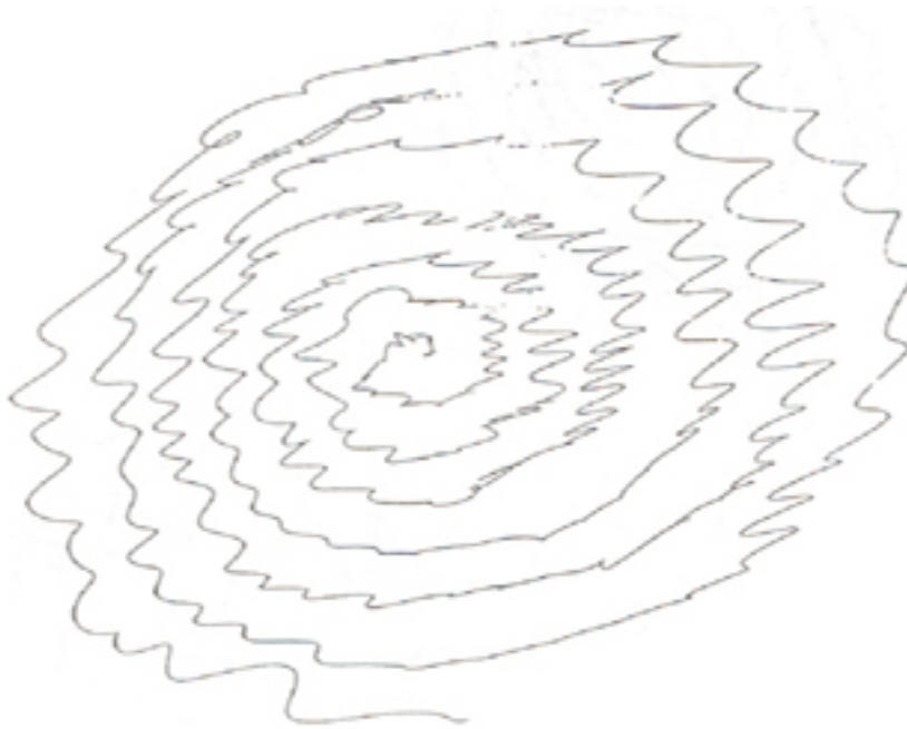
Dibuix d'una espiral feta per un pacient afectat de tremolor essencial.

Un dels trastorns del moviment del cos més freqüent en edat adulta, la tremolor essencial, no només discapacita greument a aquells que la pateixen, sinó que l'ajuda farmacològica existent es troba bastant limitada. Tenint present una de les hipòtesis més acceptades pel que fa a l'origen de malaltia -l'existència d'una disfunció en el sistema de neurotransmissors cerebrals GABA-, sí que ha estat possible que alguns fàrmacs amb principis gabaèrgics donin bons resultats. L'article següent però, demostra que la hipòtesi no és tan clara, i sobretot després que un altre fàrmac, la tiagabina, donés resultats negatius en quant a efectes adversos i manca de millora en els pacients estudiats. És evident, per tant, que cal continuar investigant la base farmacològica de la tremolor essencial.