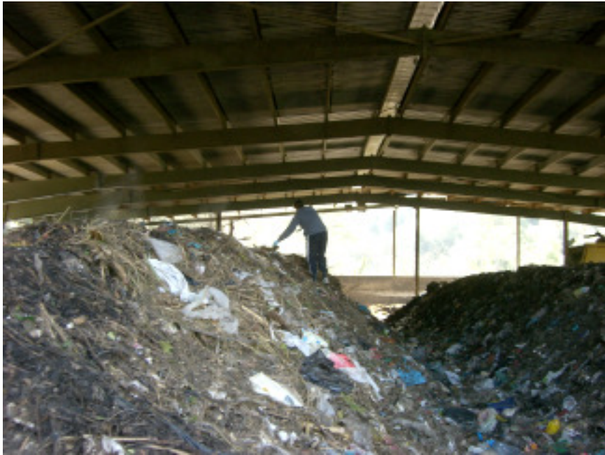
Mostreig d'emissions gasoses en piles de compostatge de fracció orgànica de residus municipals.

El compostatge és una tècnica viable i molt estesa al nostre país per tractar la fracció orgànica dels residus municipals. Com qualsevol procés industrial, el compostatge porta associada una sèrie d'impactes ambientals, com ara els derivats de les emissions gasoses i del consum de recursos. S'han determinat els impactes de dues instal·lacions reals de compostatge a Catalunya que tracten els residus urbans utilitzant com a eina l'anàlisi de cicle de vida: una d'aquestes instal·lacions és una planta de túnels amb equips per al tractament de les emissions gasoses i, l'altra, una de piles airejades completament oberta.