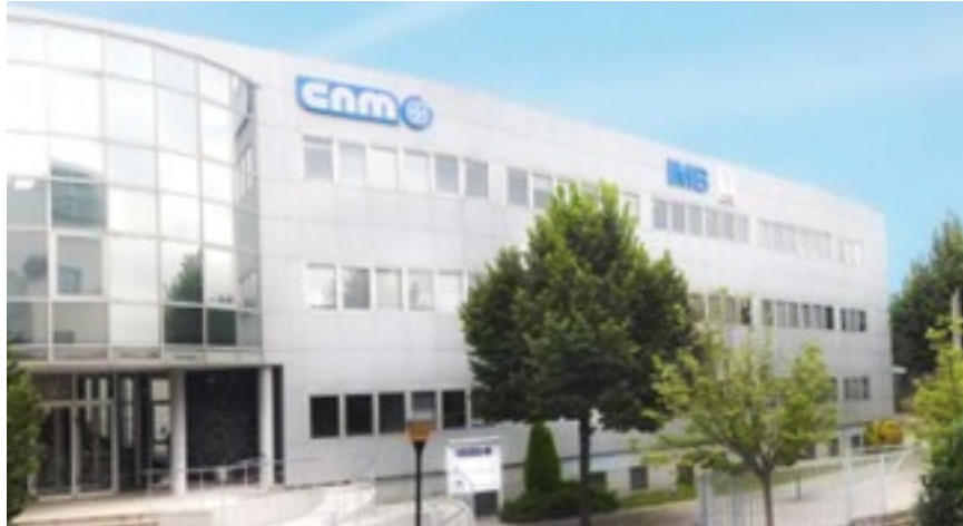
Edifici de l'Institut de Microelectrònica de Barcelona CNM-IMB, on s'ha desenvolupat la recerca.

03/2010 - Química . El rendiment dels biosensors i la seva especificitat depèn, en gran mesura, de l'èxit de funcionalització de la superfície del sensor amb biocomponents de captura adequats. Una varietat d'estratègies de biofuncionalització ha estat descrita fins ara. L'ús de proteïnes d'unió a biotina és un dels enfocaments favorits per dirigir l'orientació de les biomol·lècules i aconseguir un rendiment òptim.