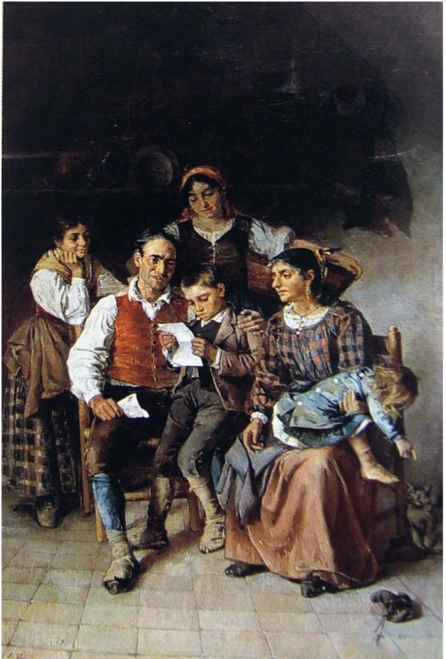
Figura 2. Maximino Peña Muñoz, La carta del hijo ausente , 1881.