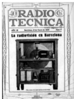
Fotografia núm. 5 – La radiovisión en Barcelona. Radio Técnica , núm. 1, año III, 15 de enero de 1929.