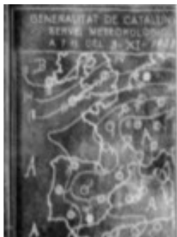
Fotografia núm. 4 – Servei Meteorològic. Orbe , núm. 7, 1 de enero de 1933, pág. 9.