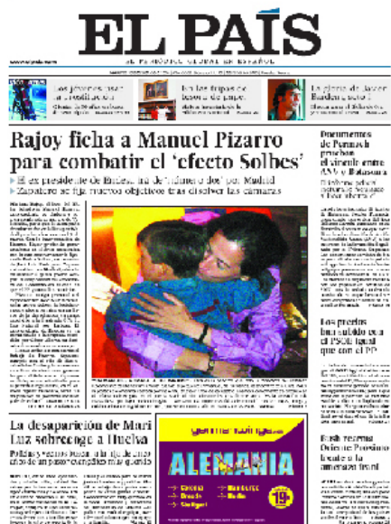
Foto 29. El País, 15/01/08, pág. 1

En ciertas ocasiones el rostro del menor aparece en la fotografía política, sea por una vinculación directa o tangencial con un acontecimiento noticioso que, de por sí, quizá justificaría la difusión de la misma por su sólido fundamento en criterios profesionales periodísticos. La liberación de las secuestradas Ingrid Betancourt y Clara Leticia Rojas, tras un inhumano secuestro por las FARC colombianas, pudiera interpretarse en esta línea (fotos 29 y 30):