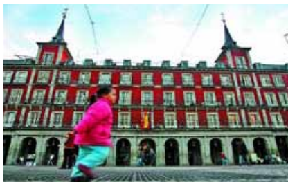
Foto 34. El País , 09/01/08, suplemento Madrid, pág. 2 / Álvaro García

Otra injustificada fotonoticia política (foto 35): el izado de las banderas en el vizcaíno Ayuntamiento de Basauri en cumplimiento de la normativa vigente. En la imagen, con el edificio consistorial de fondo, en el que ondean las enseñas, aparecen en primer plano dos sonrientes adolescentes: