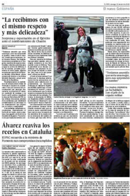
Fotos 1 y 2. El País , 13/04/08, pág. 22 / Uly Martín y Alejandro Ruesga

Para tratar de averiguar cuáles puedan ser las características y rasgos más descollantes de la deontología profesional y la práctica periodística en este ámbito se ha practicado una cala que permita orientar futuras investigaciones exhaustivas 9 .