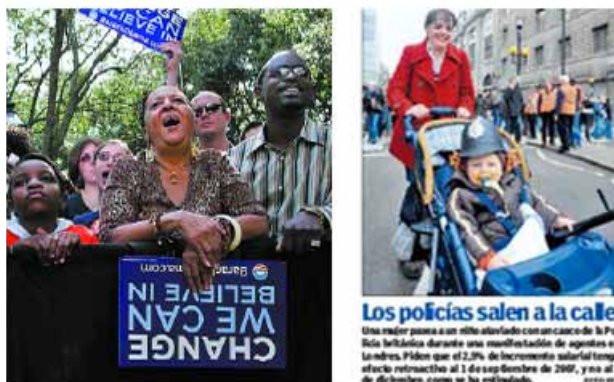
Foto 23. El País , 13/01/08, pág. 5 / AP y Foto 24. 20 Minutos , 24/01/08, pág. 8 / EFE

O bien, alentar su asistencia a actos políticos pese a la certeza de la publicidad que la cobertura informativa proporcionará a las concentraciones transformando a menores en iconos del sistema político y social de turno, como la concurrencia de colegiales cubanos que salieron a la calle con motivo del 155 aniversario del nacimiento de José Martí (foto 25), o como los adolescentes que asistieron en primera fila a los mítines de las últimas campañas estadounidenses (fotos 26–28):