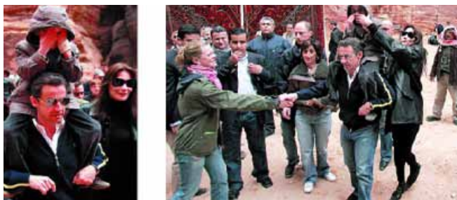
Foto 20. El País , 06/01/08, pág. 1 y 9 y Foto 21. El Mundo , 06/01/08, pág. 32

El mediático presidente francés Nicolas Sarkozy, sostuvo a hombros a Aurelien, hijo de su famosa pareja, la modelo y cantante Carla Bruni, durante una viaje de placer a Petra (Jordania). Pese a que el hijo de Bruni se tapaba su rostro con las manos u ocultaba sus ojos tras unas gafas oscuras (fotos 20 a 22) su exposición a los medios en tales circunstancias es injustificable, al igual que la profusión con que se difundieron en diarios de todo el mundo las imágenes captadas durante la visita: