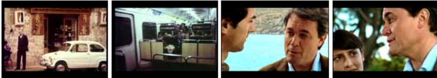
Figura 3. Selección de imágenes de las secuencias de apertura y cierre del spot electoral de Convergència i Unió (CIU), a las que separa la sobreimpresión del mensaje “1979 o futuro”.

del gobierno de la Generalitat en la que se planteaba esa misma cuestión y en la que aparecían personas anónimas destacando en qué aspectos había cambiado el país y cómo respondía el Estatut a estos cambios mediante la lectura de algunos de sus artículos (Figuras 3 y 4).