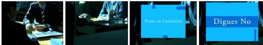
Figura 6. Secuencia de imágenes de uno de los spots electorales del Partido Popular de Cataluña, dedicado a la economía. El eslogan final reza “Piensa en Cataluña. Di NO.”

La tercera campaña, la que llevó a cabo el PP de Cataluña durante la campaña del referéndum, obvia completamente el tema de la articulación territorial de Cataluña en España y en Europa, del mismo modo que deja a un lado la cuestión de la definición de Cataluña como nación. Este partido se limita a dibujar el mundo altamente negativo para Cataluña que podría derivarse de la aprobación del Estatut. En la misma línea que la seguida por el resto de los partidos se centra en las repercusiones del Estatut sobre Cataluña y no sobre la posición de ésta en el conjunto del Estado español y de la Unión Europea. La diferencia es que para el PP, Cataluña promueve un cambio que la perjudica, Cataluña pierde con el cambio –argumentación que basa en hechos y verdades como que el nuevo Estatut limita el crecimiento económico, reduce la posibilidad de progreso, produce una excesiva planificación de la actividad económica, es demasiado intervencionista, limita la iniciativa privada, establece la laicidad del sistema educativo y abre la puerta a la eutanasia y al aborto libre (Figura 6).