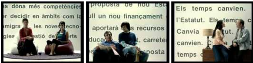
Figura 4. Selección de imágenes de los diferentes spots de la campaña institucional de la Generalitat de Catalunya bajo el eslogan final “Los tiempos cambian. Cambia el Estatut.”

Obsérvense las reminiscencias a la precampaña institucional de la Generalitat de Catalunya (Figura 4) a partir de la necesidad de cambio que imprime el paso del tiempo y el diálogo intergeneracional.