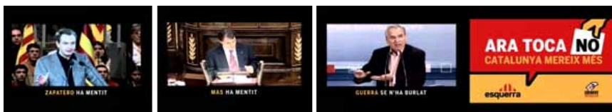
Figura 2. Secuencia de imágenes del spot electoral de la formación Esquerra Republicana de Catalunya (ERC). Inserciones iniciales de José Luis Rodríguez Zapatero, Artur Mas y Alfonso Guerra e imagen de cierre, con el eslogan: “Ara toca NO. Catalunya mereix més.”

Otra estrategia en la presentación de las relaciones entre España y Cataluña es la llevada a cabo por ERC. La formación republicana identifica España con “Madrid” y se refiere al nuevo Estatut como “el Estatut de Madrid”. Afirma que “Madrid” gana con el nuevo Estatut lo que Cataluña pierde, dando lugar a unas relaciones de tensión y de oposición claras. El mundo posible dibujado por ERC plantea como hechos fundamentales que “Madrid” recorta las pretensiones económicas y políticas de Cataluña al tiempo que se burla de ella –aparecen las famosas declaraciones de Alfonso Guerra diciendo que en la Comisión Parlamentaria se le pasaría al Estatut el cepillo del carpintero hasta dejarlo irreconocible– o, directamente, la traición mediante la mentira –aparecen José Luis Rodríguez Zapatero afirmando que iba a respetar el Estatut que saliera del Parlamento de Cataluña y las imágenes del apretón de manos entre Artur Mas y el Presidente del Gobierno español (Figura 2)–.