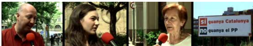
Figura 1. Secuencia de imágenes de los spots electorales del Partit dels Socialistes de Catalunya (PSC). Las declaraciones de diversos ciudadanos a pie de calle siguen al rótulo inicial impreso en pantalla: “Las personas que aparecen a continuación han expresado libremente su opinión.” El spot se cierra con la imagen del cartel electoral del PSC, que reza: “Sí, gana Cataluña. NO, gana el PP.”

Otra estrategia en la presentación de las relaciones entre España y Cataluña es la llevada a cabo por ERC. La formación republicana identifica España con “Madrid” y se refiere al nuevo Estatut como “el Estatut de Madrid”. Afirma que “Madrid” gana con el nuevo Estatut lo que Cataluña pierde, dando lugar a unas relaciones de tensión y de oposición claras. El mundo posible dibujado por ERC plantea como hechos fundamentales que “Madrid” recorta las pretensiones económicas y políticas de Cataluña al tiempo que se burla de ella –aparecen las famosas declaraciones de Alfonso Guerra diciendo que en la Comisión Parlamentaria se le pasaría al Estatut el cepillo del carpintero hasta dejarlo irreconocible– o, directamente, la traición mediante la mentira –aparecen José Luis Rodríguez Zapatero afirmando que iba a respetar el Estatut que saliera del Parlamento de Cataluña y las imágenes del apretón de manos entre Artur Mas y el Presidente del Gobierno español (Figura 2)–.