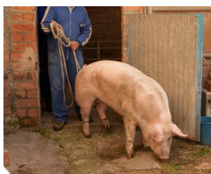
Cerdo de matanza

Se efectuaron visitas concertadas con entrevistas a personas que actualmente celebran o que han dejado de celebrar la matanza del cerdo. Contestaron un cuestionario antropológico, de salud pública y técnico (material, personal y procedimiento), con un anexo de léxico local. Se realizaron nueve entrevistas en cinco comarcas catalanas de la Catalunya Vella (Bages (1), Berguedà (2), Pla de l'Estany (2), Selva (2) y Vallès (2)):