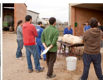
Cornellà del Terri (2008)