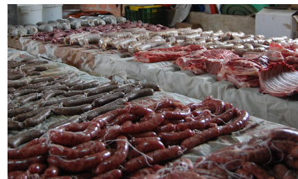
Butifarras y despiece de matanza