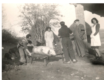
Mas Ciurana, Hostalric (1948)