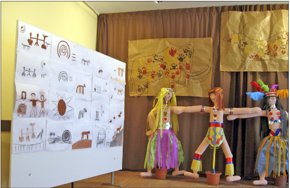
Figura 2. Exposició dels treballs realitzats per la ZER Montsec entorn les pintures de la cova dels Vilars (Os de Balaguer).

material, quan siguin capaços de produir emocions, és a dir, quan siguin capaços d'incidir en la sensibilitat de les persones d'aquella col·lectivitat on es troba. Aquest valor emotiu dels elements patrimonials dependrà en aquest cas tant del seu context sociocultural com de les circumstàncies de recepció d'aquests béns, entre elles, de manera prioritària, l'educació. Treballar des de l'acció educativa a escoles i instituts la percepció i la interpretació del passat comú permet aprendre tant el coneixement com les emocions envers el patrimoni comú, i això esdevé un objectiu prioritari que permet augmentar tant la capacitat d'entendre aquest passat des del present —i per tant entendre el present— com l'espectre d'emocions que generen en les persones aquests béns patrimonials.