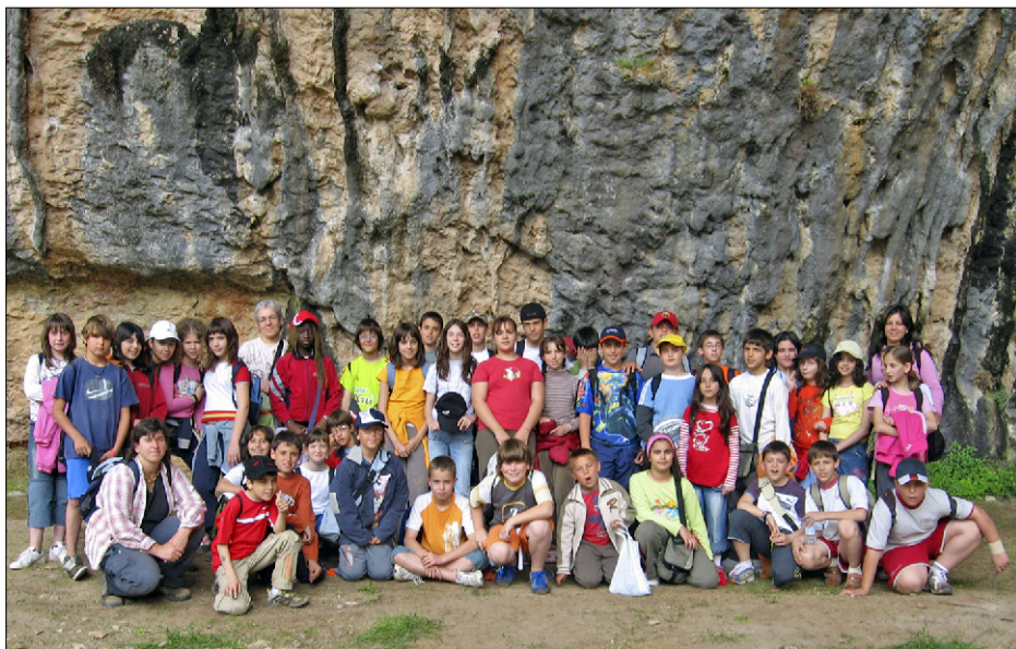
Figura 4. Visita d'un grup de Cicle Superior de l'Escola Gaspar de Portolà a la cova Gran de Santa Linya.