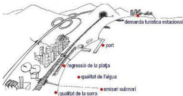
Figura 2. Problemàtica litoral.

La gestió de les costes ha de ser global i ha d'incorporar el concepte de desenvolupament sostenible. Ha de gestionar problemàtiques comunes al llarg del litoral com: