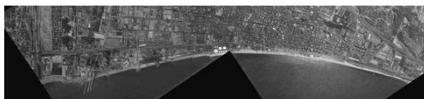
Vista de la costa de Badalona des d'un vol aeri CETFA (juny de 1962). Museu de Badalona. Arxiu d'imatges. Fons: Ajuntament de Badalona

L'itinerari passa pel port de Badalona on es pot observar la diferent sedimentació a un cantó i a l'altre del mateix port. Aquest fenomen és observable també en altres ports molt propers: El Masnou i Premià de Mar. Aquesta observació es pot fer aprofitant el tren com a transport; una altra possibilitat és utilitzar mapes on es tingui una visió global de la zona (fig. 4).