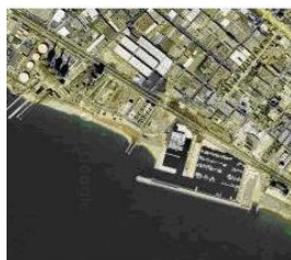
Vista del port de Badalona des del google Earth (2008)