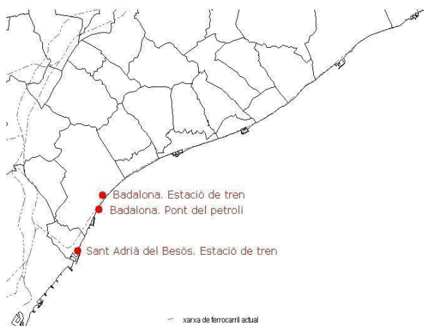
Figura 3. Mapa de l'itinerari.