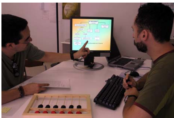
Imatge: procés de tutorització presencial amb el representant del grup (esquerra)

Un cop realitzat el material docent, els alumnes l'exposaven en una sessió i més tard aquest material era introduït en la secció de 'Materials' del CV com a material docent del curs que els alumnes podien consultar lliurement.