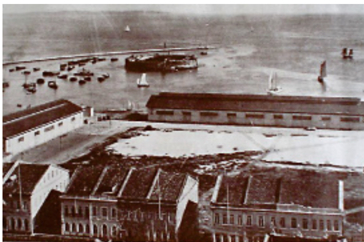
Figura 1: Vista parcial do porto de Salvador, em 1917

Não se sabe ao certo quando a gripe atingiu Salvador, cidade cujo porto possuía conexões transcontinentais desde a sua fundação, em 1549 5 . O mais provável é que tenha chegado com o paquete inglês Demerara , que aportou na cidade no dia 11 de setembro de 1918, trazendo a bordo passageiros infectados com a doença 6 . Dias depois, a imprensa registrou dois óbitos entre os passageiros desembarcados e a doença começou a se espalhar sem que a Diretoria Geral da Saúde Pública da Bahia tomasse conhecimento do caso 7 .