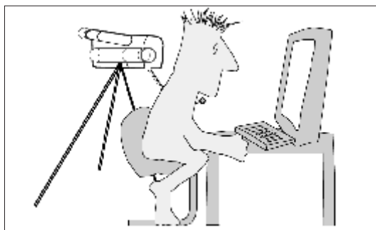
Figura 1. Posición del participante, de la cámara, del micrófono y del simulador en la situación experimental.

extensible, las verbalizaciones del individuo. (Figura 1) También se utilizó una ficha de registro de los comportamientos observados tanto a través de la cámara, como a través del micrófono.