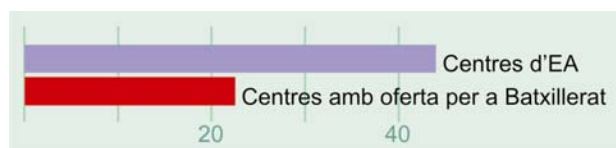
Figura 1. Centres del medi litoral-marí en comparació amb els que ofereixen activitats per a batxillerat.

L'univers de l'estudi consta de 43 centres d'EA que treballen el medi litoral marí en les comarques litorals catalanes. Se'n seleccionen els 22 centres que ofereixen un total de 35 activitats per a batxillerat (fig. 1).