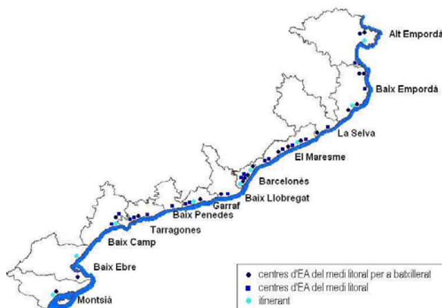
Figura IV. Distribució dels centres d'EA en el litoral català.

Els centres d'EA estudiats es distribueixen en totes les comarques i es concentren en les àrees més poblades de l'àrea metropolitana de Barcelona i de Tarragona. Majoritàriament els centres es troben i tenen el seu marc d'actuació fora dels espais del PEIN, Pla d'Espais d'Interès Natural. Cal dir que les zones costaneres incloses en aquesta categorització són poques i que les zones més densament poblades es situen justament en la franja costanera (fig. 4).