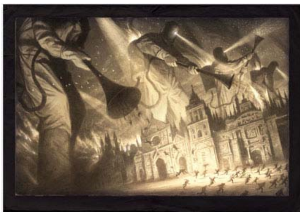
Figura 1. Alan observa la ilustración

Paola también es consciente de las intenciones del ilustrador cuando muestra cómo éste utiliza la luz para enfatizar la situación de explotación sufrida por los personajes: “mira, aquí el dibujante lo iluminó más para que se vieran todas las chicas aquí limpiando”. Como afirma Gisela, este uso de la luz permite en otras ocasiones “diferenciar las cosas y ver entre la sombra y qué no es sombra [...] para ver si es que es día o noche”. Alan, cuando observa la ilustración de los gigantes aspirando a los hombres (Figura 1), diferencia entre el uso del color y de la luz, pues indica que allí “no parece que fuera sólo en blanco y negro, puede ser que está... cómo está iluminado”. El manejo que este ilustrador hace de la luz y el modo “como utiliza los colores” lo llevan a pensar que se trata de un “profesional”: “creo que es muy difícil hacer esto... bueno, para profesionales no debe ser tan difícil”.