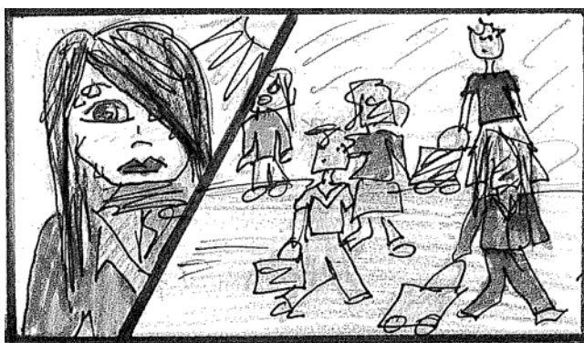
Figura 5. Buscando cobjio