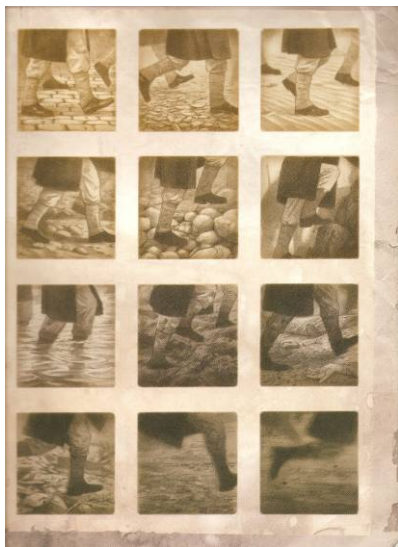
Figura 2. Las piernas de los soldados

Otro modo de sugerir el movimiento es el uso de los colores, texturas y maneras de dibujar, que pueden ser más nítidas o más borrosas para indicar una marcha lenta o más rápida. En la historia del anciano que ha participado en una guerra y ha perdido allí la pierna hallamos una página construida mediante pequeñas viñetas, donde se enfocan sólo las piernas de los soldados que van recorriendo los distintos caminos (Figura 2).