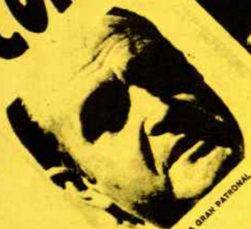
LOPEZ DE LETONA: LA GRAN PATRONAL