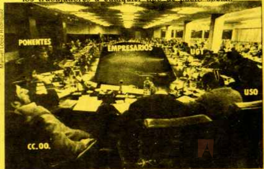
Empresarios y obreros, sentados a la mesa en el Palacio de Congresos y Exposiciones al margen de los verticalistas.