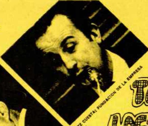
FERNÁNDEZ CUESTA: FUNDACIÓN DE LA EMPRESA