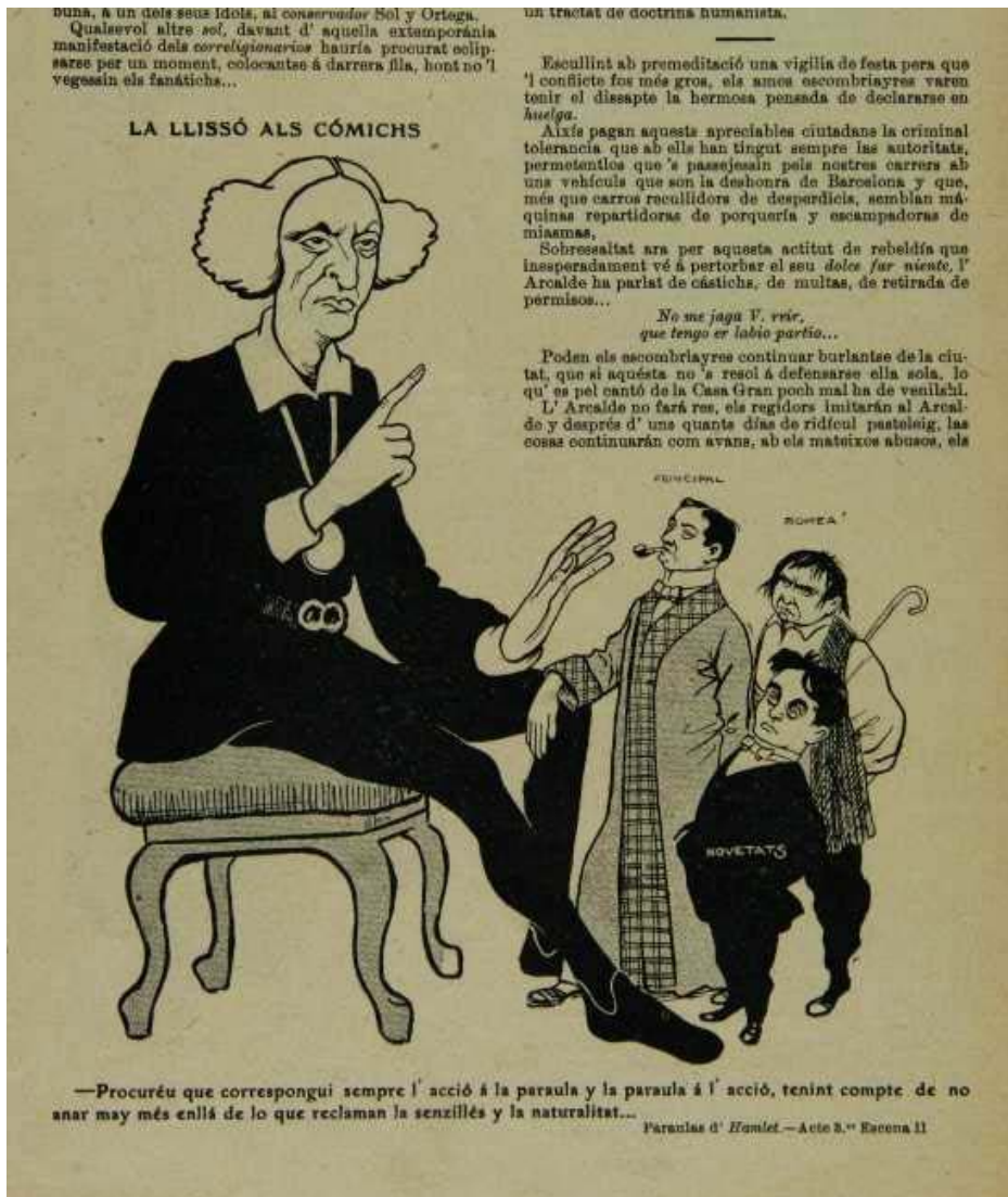
Els consells de Garavaglia/Hamlet als comedians. ( L'Esquella de la Torratxa , 1909, 356.)

Però també es veu reforçat per la manera com Hamlet pren vida fora de l'obra, a les nombroses hamletologies que s'han desenvolupat a l'entorn del personatge. Això es veu sobretot en la representació que fa Hamlet dels problemes de la representació quan prepara l'obra dins de l'obra amb els comedians; les seves paraules en aquest context són el que han contribuït que es veiés el paper de Hamlet com a actor i, per extensió, dramaturg. També han portat que es col·lapsés la distinció entre el personatge i Shakespeare, en reflectir les preocupacions del «gran home de teatre». Aquesta tendència es detecta a Catalunya en la pràctica bastant estesa de posar els consells de Hamlet als comedians en boca de Shakespeare, com si en constituïssin el missatge més important per a la posteritat. Es troba en revistes dels anys 1909, 1910 i 1911, com ara De Tots Colors , Juventut Teatral , L'Esquella de la Torratxa i El Teatre Català ; però tornarà a aparèixer més tard en espectacles, com el Tant per Tant Shakespeare de Peggy Cherns (1995), que va començar amb els consells de Hamlet , en traducció de Salvador Oliva, a més d'estudis, com ara El mirall embruixat de Josep Palau i Fabre (1962). (4)