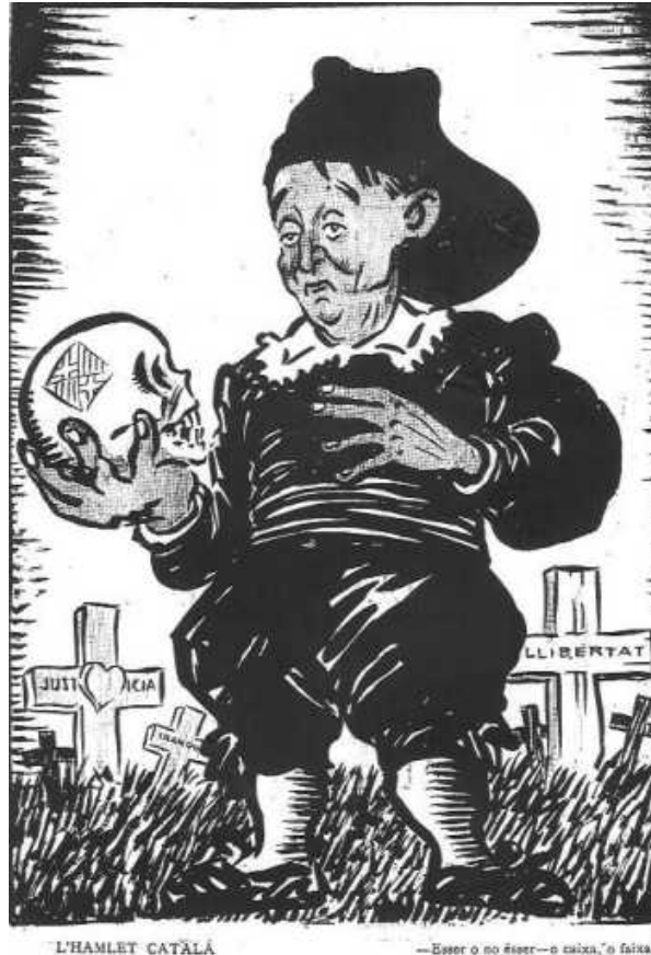
L'Hamlet català. «—Ésser o no ésser — o caixa o faixa!» ( L'Esquella de la Torratxa , 22 juny 1923.)

La insinuació que la qüestió essencial de Hamlet només és accessible per a la persona que reflexioni és un motiu que torna a sorgir en el Hamlet , dramaturg de Vinyes de 1944: una sàtira mordaç dels valors petit-burgesos a Catalunya que recorda altres representacions de la burgesia catalana. Per exemple, a L'Esquella de la Torratxa del 22 de juny 1923 es representa la reacció de les classes benestants enfront de la dictadura de Primo de Rivera amb l'imatge d'un Hamlet català. Dibuijat amb barretina, entre les tombes de la Llibertat, la Pau i la Justícia, la qüestió essencial arriba a ser aquesta: «—Ésser o no ésser — o caixa o faixa!» (440).