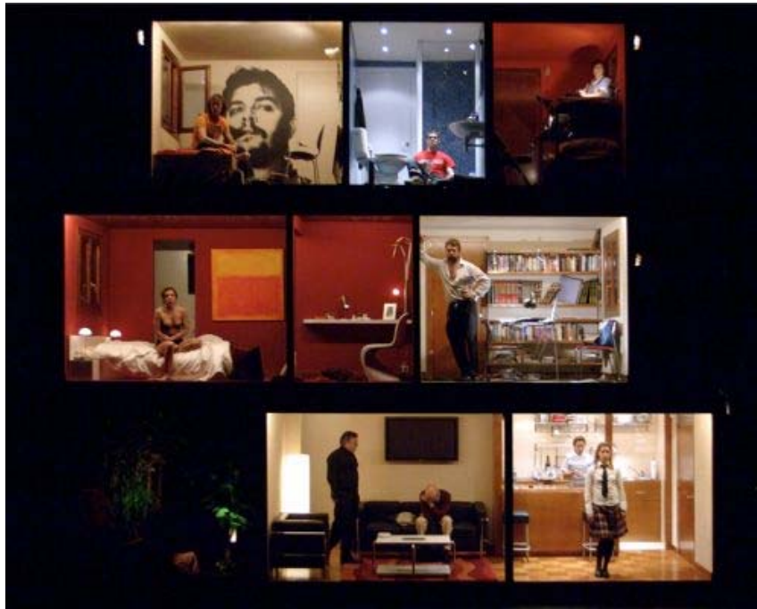
European House , dir. Àlex Rigola.

Tornem a trobar plasmat el miratge revolucionari que representa Hamlet , alhora que la repetició ineluctable de la lluita entre orígens i originalitat. Ara bé, aquí se'ns proposa veure en aquest miratge el mirall de la nostra pròpia identitat, i reconèixer, per tant, el significat contemporani del «ser o no ser»: «Escriure si volem viure i així produir canvis, o simplement morir en vida. Com tots els vius i tots els morts d'aquesta European House » (Rigola, 2006, s. n.). D'aquesta manera, tot retornant als orígens de la qüestió, Rigola acaba presentant un Hamlet català que reclama la seva originalitat: uns tòpics de Shakespeare en català que arriben a contenir i delimitar la identitat europea contemporània.