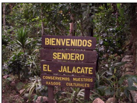
Foto 3. Rótulo identificativo en El Jalacate