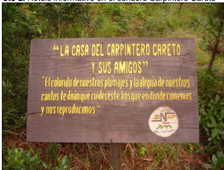
Foto 2. Rótulo informativo en el sendero Carpintero Careto

En la Reserva Natural El Tisey-La Estanzuela ya existen, en algunos puntos, rótulos, con lo que se aconseja que se siga el mismo modelo.