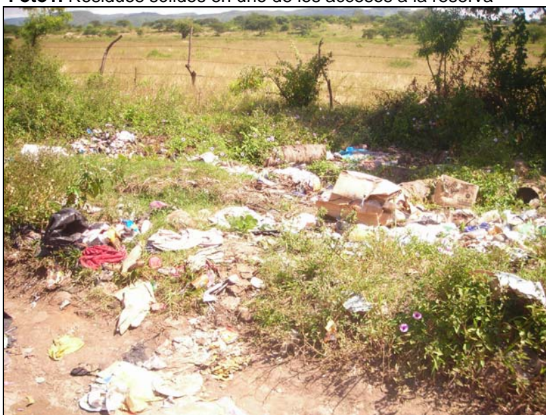
Foto1. Residuos sólidos en uno de los accesos a la reserva