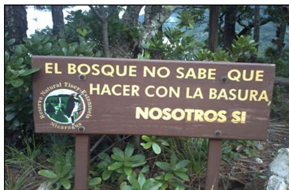
Foto 4. Rótulo informativo en el Sendero Carpintero Careto