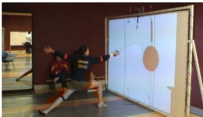
Figura 2.- Test de Tiempo de Respuesta Simple sobre un estímulo no específico de esgrima utilizando el fondo para tocar. (TRespS-if).

- Test de Tiempo de Respuesta Simple sobre un estímulo no específico de esgrima utilizando el fondo para realizar el tocado (TRespS-if) . En el cuál se realizó la tarea descrita anteriormente (TRVS-i), pero en este caso, los puntos se proyectaron sobre la pantalla y el Tiempo de Respuesta Simple se registro mediante el tocado de la pantalla con la punta del arma, tal y como se muestra en la figura 2.