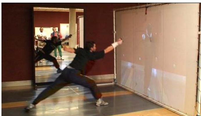
Figura 3.- Test de Tiempo de Respuesta Simple sobre un estímulo específico de esgrima utilizando el fondo para realizar el tocado (TRespS-ef).

Tras realizar las tareas expuestas anteriormente, se presentaron de la misma forma en la pantalla bloques de acciones de esgrima, en los que el tirador debía tomar decisiones de dificultad creciente antes de tocar la pantalla. De nuevo, los esgrimistas tuvieron que utilizar el fondo como acción para asestar el tocado. El orden en el que aparecieron las acciones concretas fue aleatorio.