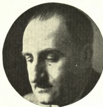
Γ Ε Ω Ρ Γ Ι Ο Σ Δ Ο Υ Ρ Α Σ

Φίλε, σά δεῖς βαρὺ τὸ σύννεφο τῆς νύχτας τριγύρω σου, στὴν πᾶσα χτίση γύρω· σά θᾶναι οἱ ὥρες τοῦ βραχνᾶ, ποὺ τὴν ἀνάσα πνίγει, κι ὅμοιες θηλειᾶς τῆς ἀγωνίας οἱ ὥρες, πέτρα σά θᾶναι τὸ ψωμί, σκληρὸ τοῦ πόνου, καὶ τὸ πιотὸ ἄλμυρὸ — πιотὸ δακρῶν, κι αἷμα ὁ ἰδρώτας στὰ κορμιά, στὰ μέτωπα ὄλα· σά θὰ γρικᾶς τρανὸ τοῦ ἐχθροῦ στὴ νύχτα τὸ ποδάρι, μακριάθε ὀλοένα τρόμος νά σιμώνει, κι ἀλόγων ποδοβολητό, μυριάδων μύριων, φριχτὸ ποτάμι ἀκράτητο, κι ἀρμάτων, πλήθιων ἀρμάτων σιδερένιων τρόμος· σάν ἡ καρδιά κερὶ θά πάει νά λυώνει ἐντός σου, καὶ τὸ γόνα, τὰ γόνατα ὄλα θὰ ρένε, ἴδιο νερό, κρυφὰ θὰ παραλυοῦνε, ἀλύγιστες φτεροῦγες μαῦρες τοῦ θανάτου, καὶ φλόγα ὀλέθρου μὲς τῆ νυχτιά θὰ ὑψώνεται πελώρια, τριγμοὶ καὶ κρότοι ὀλοῦθε ὀλέθρου, φρίκης γιορτάσι — μὴ φοβηθεῖς — τὸ φῶς δὲ χάθηκε γιὰ πάντα! — κι ὡς τοῦ χαμοῦ τὸ βῦθος μὴν τρομάξεις. Μὴ σβήσεις τὴ γλυκειά σου ἐλπίδα, φίλε! Τί, στὴν κραυγή σου, στὴν κραυγή μας, κάποιες θ' ἀνοιξοῦν ἀκοῆς — ψηλά θ' ἀκούσουν — κάποια ἱερά θὲ νά συγκλίνουν σπλάχνα.