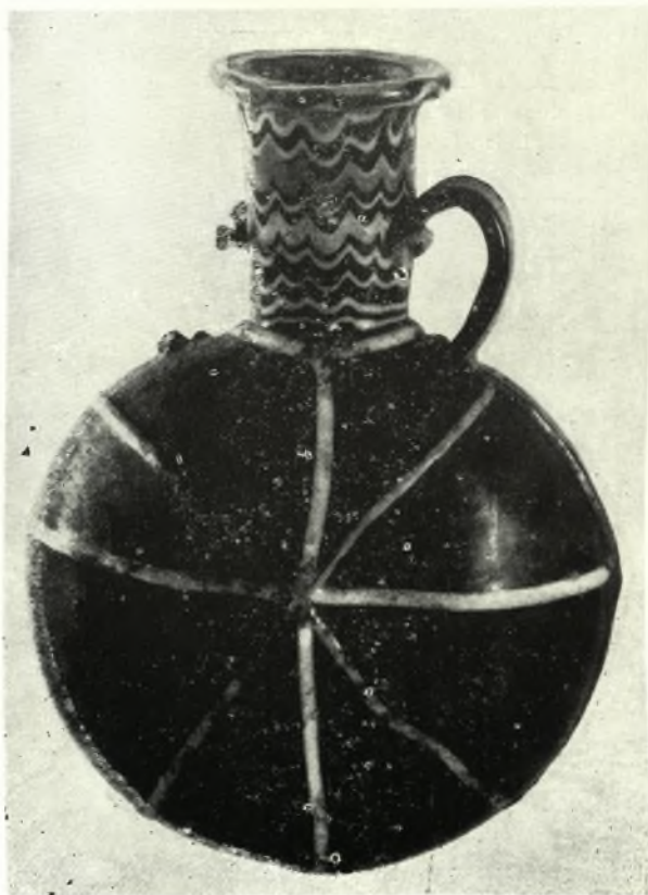
Ειχ. 2. - Egyptian Glass Flask in private collection.