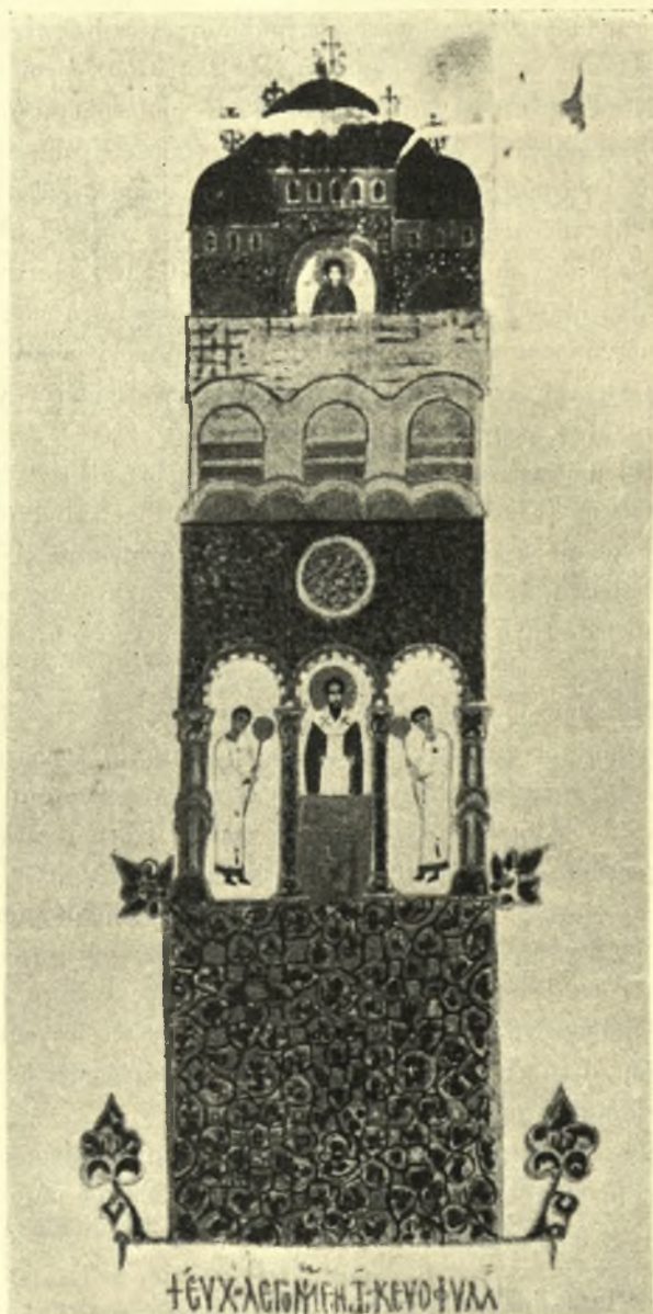
Εικ. 8. 'Επικεφαλis τοῦ ὑπ' ἀριθ. 707 λειτουργικοῦ εἰλη- ταρίου τῆς Μονῆς Πάτμου (Jacori).