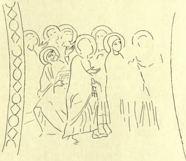
Εἰκ. 6. Τμῆμα τοιχογραφίας τῆς Ἀναλήψεως ἐν τῷ Ναῷ τοῦ Χρυσοστόμου ἐν Γερακίῳ.

στατο κυρίως εἰς τὴν τοποθέτησιν τῆς Θεοτόκου. Ἐδοκιμάσθησαν λοιπὸν διάφοροι λύσεις, ἀκόμη καὶ ἡ παράλειψις τῆς Θεοτόκου, ὅπως εἰς τὴν Ὅμορφην Ἐκκλησίαν τῆς Αἰγίνης 1 . Ἡ κατὰ τὸν 12 ον αἰῶνα ἐπικρατήσασα λύσις ἦτο νὰ εἰκονίζωσι τὴν Θεοτόκον μετὰ τοῦ ἀριστεροῦ ὁμίλου τῶν Ἀποστόλων ἐστραμμένην πρὸς δεξιὰ. Οὕτως εὐρίσκομεν αὐτὴν καὶ εἰς τὴν ἀνέκδοτον εἰσέτι τοιχογραφίαν τοῦ Ναοῦ τοῦ Χρυσοστόμου ἐν Γερακίῳ (Εἰκ. 6), ὅπως καὶ εἰς μερικὰ ἔργα μικροτεχνίας ἐμπνεόμενα ἀναμφιβόλως ἀπὸ ψηφιδωτὰ ἢ