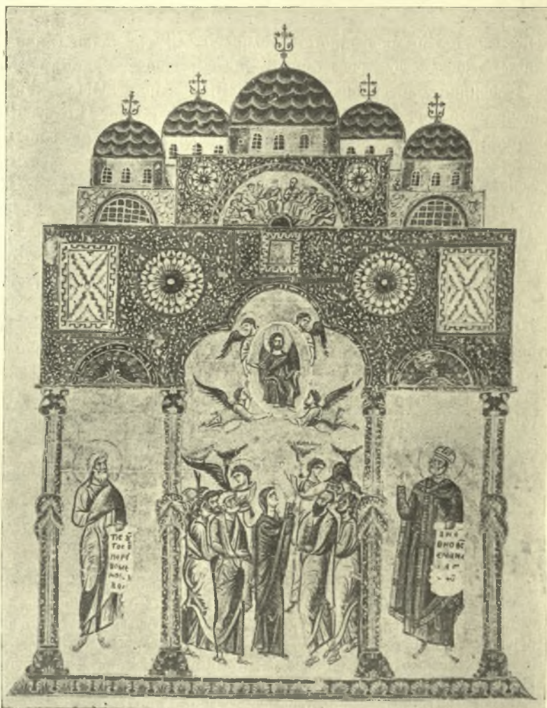
Εἰκ. 1. Ἡ προμετωπίς τοῦ κώδ. 1162. τῆς Βιβλιοθήκης τοῦ Βατικανοῦ.

Ἐάν ἐξετάσῃ τις ἐπισταμένως τὰς δύο μικρογραφίας, θὰ παρατηρήσῃ ὅτι οἱ τέσσαρες περὶ τὸν κεντρικὸν τροῦλλον, μικρότεροι ὀλίγον ἐκείνου, εὐρί-