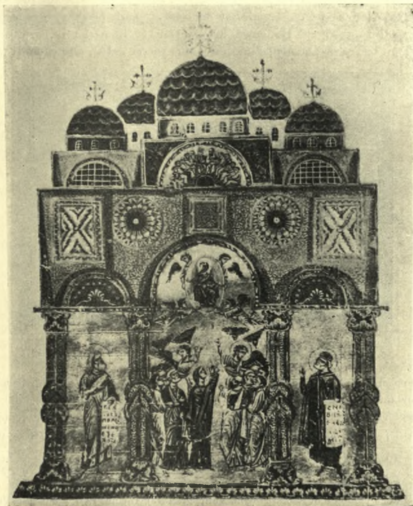
Εἰκ. 2. Ἡ προμετωπὶς τοῦ κώδ. 1208 τῆς Ἐθνικῆς Βιβλιοθήκης τῶν Παρισίων.

Ἄλλὰ ὁ ὑπὸ τοῦ Ἰουστινιανοῦ ἀνεγερθεὶς ἐν Κωνσταντινουπόλει Ναὸς τῶν Ἁγ. Ἀποστόλων ἐκαλύπτετο μὲν ὑπὸ πέντε τρούλλων, ἢ ἐπὶ τῆς στέγης ὅμως διάταξις αὐτῶν ἦτο διάφορος. Οἱ τέσσαρες δηλαδὴ περὶ τὸν κεντρικὸν