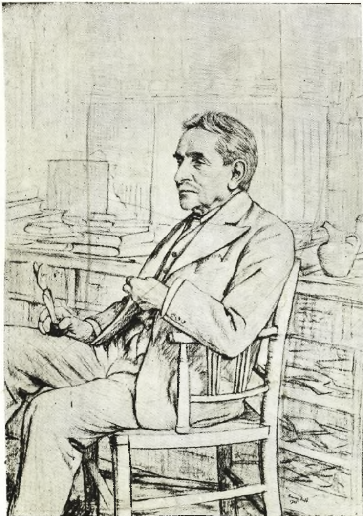
Sir ARTHUR EVANS