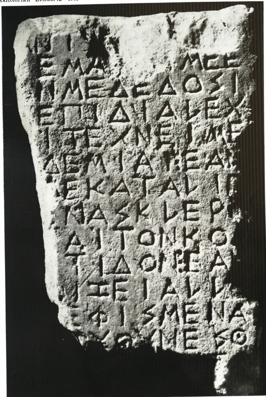
Ἐνεπίγραφος στήλη ἐκ Σπάτων Ἀττικῆς.