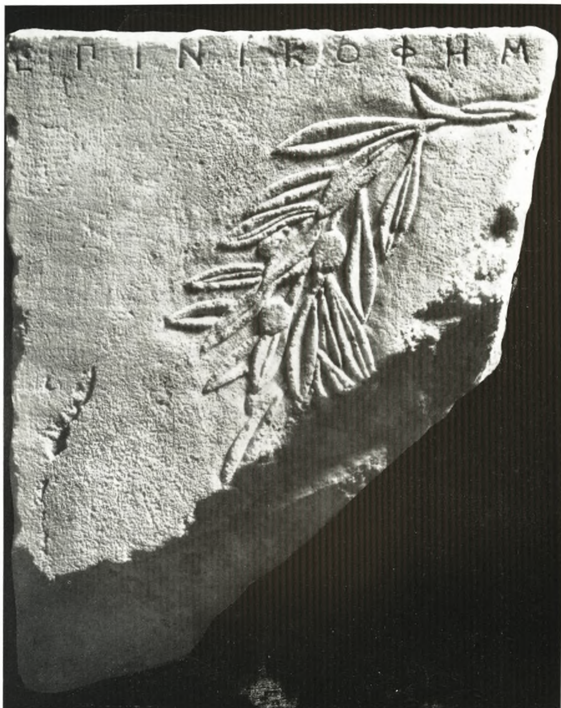
Τὸ ἄνω μέρος τῆς στήλης ἐκ τῆς ὁδοῦ Δαβάκη.