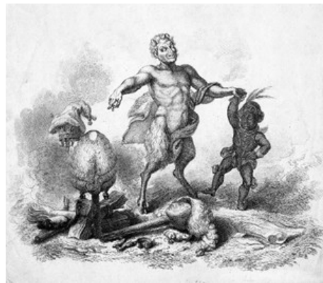
Fig. 1 – Frontispiece illustration to vol. i of the Black Dwarf , 1818

I am not, I find, to go to court at St. James’s; but to one opened periodically at Warwick. They consult my preference of the country in this warm season, and indulge me with a journey to that ancient and respectable town, where I shall no doubt be taken proper care of, and every attention will be paid to my comfort, and consolation ( LBD , August 11, 1819, vol. iii: 524-5).