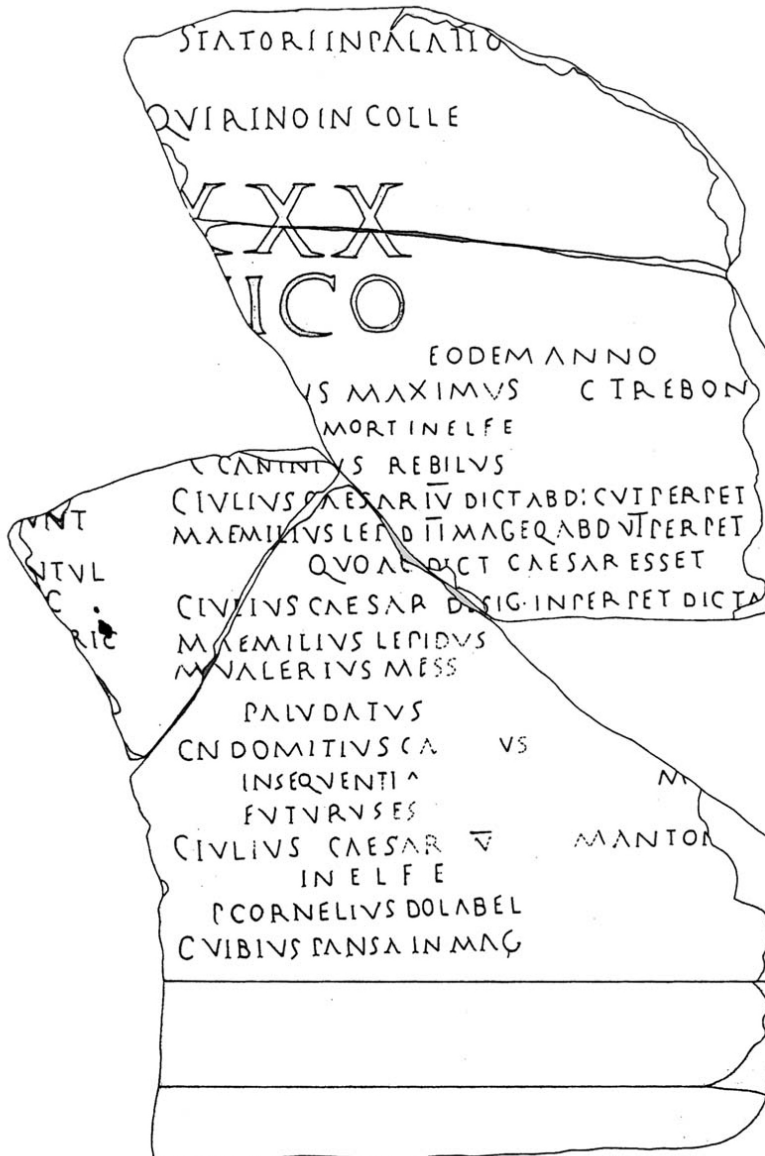
Fig. 2. Fasti Privernati, frammento b (da Zevi 2016 – Archivio Museo Arch. Priverno, dis. R. Floris, cortesia M. Cancellieri)