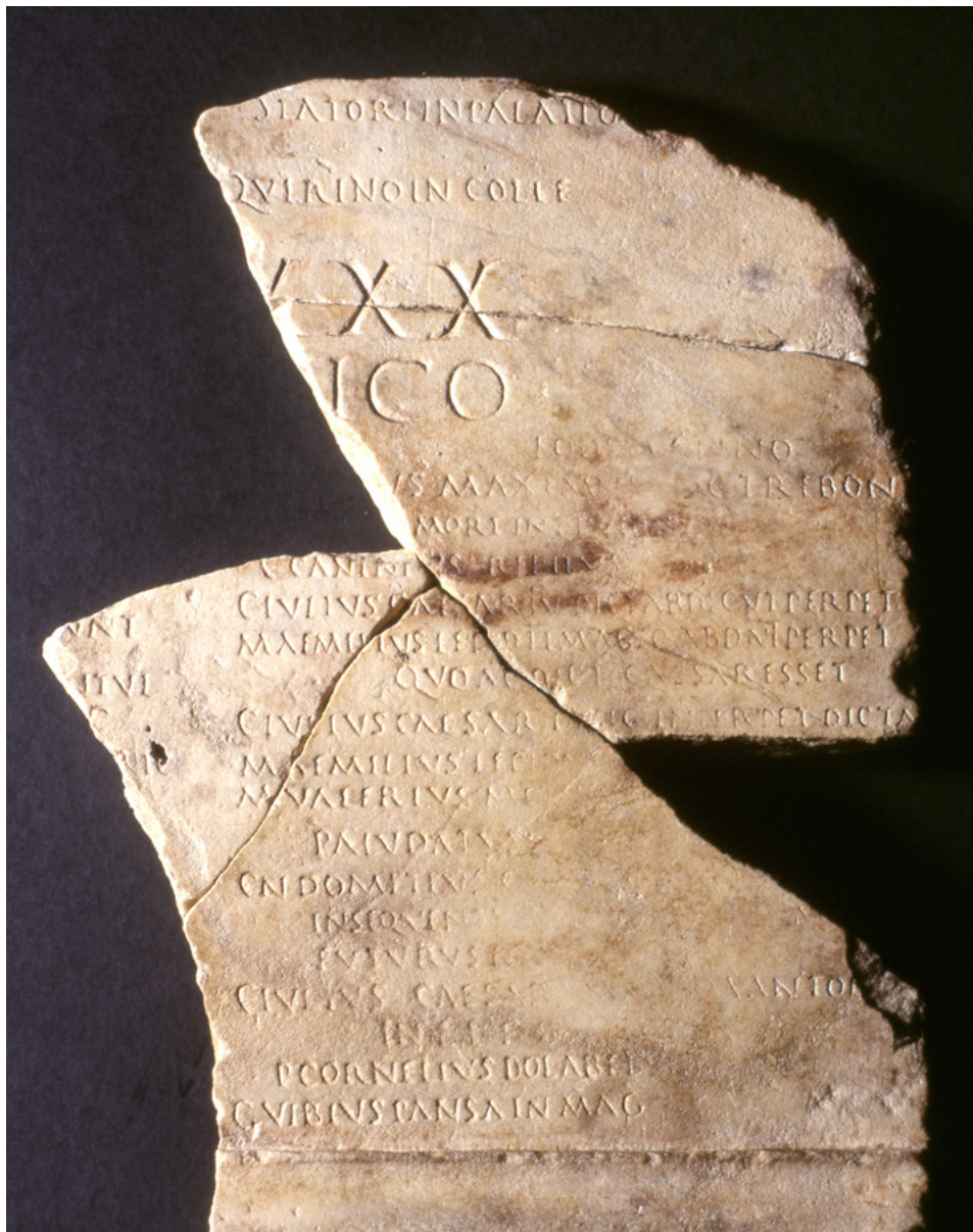
Fig. 1. Fasti Privernati, frammento b (da ZEVI 2016 – Archivio Museo Arch. Priverno, foto L. De Masi, cortesia M. Cancellieri)