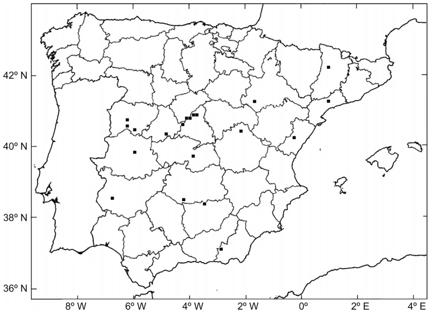
Figura 2. Distribució a la península Ibèrica d' Arabis nova subsp. iberica .

Aquest tàxon es coneixia únicament a Catalunya de les muntanyes de Prades (Sáez et al., 2000; Aymerich & Sáez, 2001). A la fig. 2 s'estableix un mapa de distribució a la península Ibèrica del tàxon, fet sobre la base de les nostres dades i, fonamentalment, a partir de referències bibliogràfiques (Talavera & Velayos, 1994; Mateo & Martínez, 1996; Mateo & Hernández, 1998; Lorite et al., 1999; Sáez et al., 2000). A. nova subsp. iberica fou considerada per Sáez & Soriano (2000) com una espècie assimilable a la categoria IUCN (2001) de dades deficientes (DD), ja que en aquell moment la seva presència a Catalunya es fonamentava en un plec d'herbari (Sáez et al., 2000), i posteriorment ha estat assignada a la categoria de vulnerable (Aymerich & Sáez, 2001).