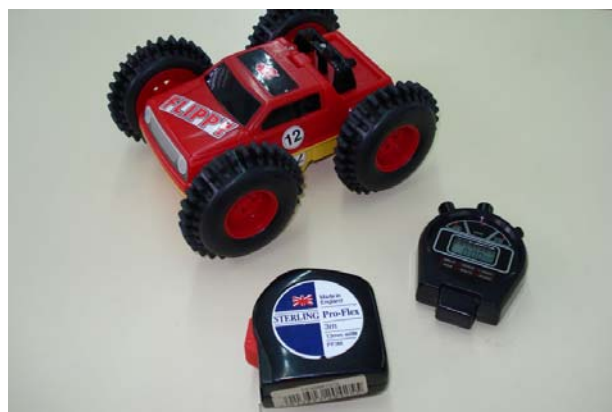
Figura 1. Material necessari per dur a terme la pràctica.

Amb aquests objectius es pretén treballar la competència científica, que és la competència més característica de la nostra matèria; però també punts essencials de les competències comunicati-