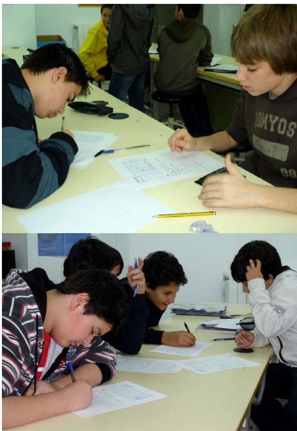
Figures 4a, 4b. Alumnes fent el tractament de les dades

Totes les dades recollides es van anotant en una taula. També es calcula i anota a la mateixa taula el temps mitjà per a cada distància (fig. 3).