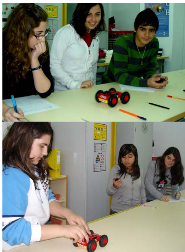
Figures 2a, 2b. Alumnes durant el desenvolupament de l'experiència pràctica.

En el nostre cas, els alumnes marcaven a la superfície de treball posicions distanciades entre si 20 cm (va ser la distància de separació que ells van triar més sovint). La majoria indicaven amb llapis o bolígrafs aquestes posicions (fig. 2a).