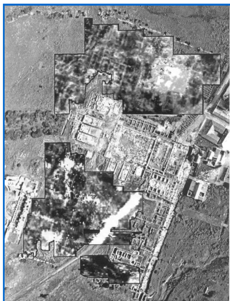
Resistivitat a Baelo Claudia (Cadis) (TERRA NOVA Ltd.)