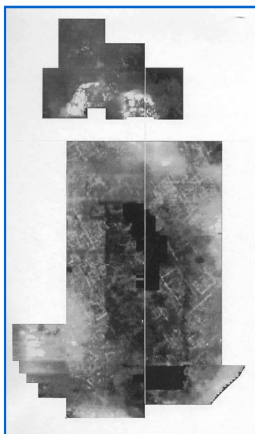
Prospecció de Puente Tablas (TERRA NOVA Ltd.)

Una de les primeres disciplines humanístiques que va incorporar les tecnologies de la informació va ser precisament l'arqueologia, que fa poc va celebrar el 25 aniversari dels Congressos Internacionals sobre el tema (Computer Applications in Archaeology, Birmingham 1972-1997). Hi ha hagut diversos camps d'aplicació de programaris i maquinaris informàtics en arqueologia, però potser un dels més autòctons o genuïns de l'especialitat és la prospecció geofísica, i sobretot en el fa al seu tractament digital en els darrers 20 anys.