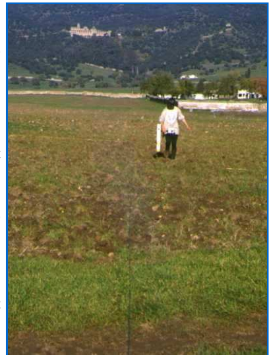
Magnetometria de Madinat Azahara (Córdoba)

Al contrari que la resistivitat, una prospecció magnètica o magnetometria és molt ràpida ja que les lectures es realitzen amb un temporitzador incorporat al aparell conegut com magnetòmetre, que va prenent lectures a mida que el prospector camina al llarg de la quadrícula. En aquest cas és molt important que el prospector porti sempre un mateix ritme de pas per tal que l'aparell faci una lectura precisa en el punt corresponent de lectura. D'altra secret d'una bona magnetometria és que no es produeixi cap oscil·lació de l'aparell mentre es realitza la prospecció, sinó es registren variacions magnètiques importants .