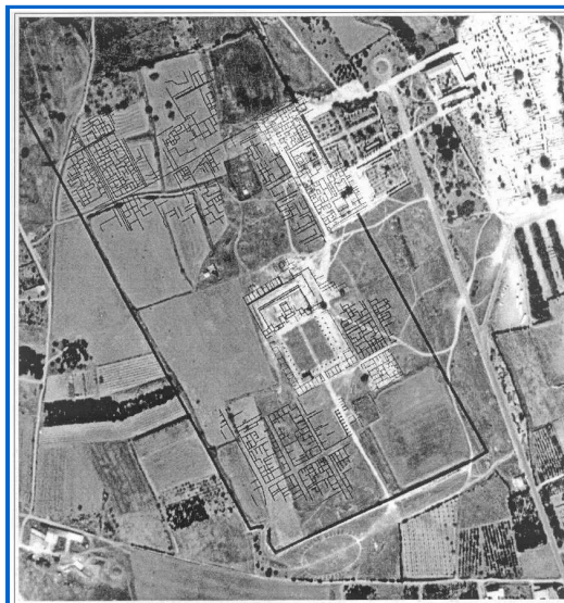
Interpretació de la prospecció d'Empúries (TERRA NOVA Ltd.)

Una altra aspecte important en el tractament informàtic de les prospeccions és la juxtaposició dels resultats obtinguts a partir de diverses tècniques complementàries. Els mapes individuals de cadascuna de les prospeccions es poden combinar al disposar de una sèrie de lectures per cada punt, amb aquests valors individuals es pot fer qualsevol operació matemàtica (sumar, multiplicar etc...). Al tractar-se de mapes en format raster, cada coordenada (columna, fila) té un valor el qual s'identifica a través del color de la paleta (generalment paletes de grisos). Si dos mapes tenen les mateixes coordenades i el mateix nombre de columnes i fileres com serien els resultants d'una resistivitat i una magnetometria, es poden combinar. El mapa resultant sorgirà del valor obtingut de l'operació matemàtica que combinava els valors dels mapes per cadascuna de les coordenades (filera – columna).