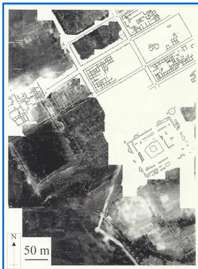
Prospecció d'Itàlica (Sevilla) (TERRA NOVA Ltd.)

Tots els mètodes de prospecció geofísica fan servir una logística similar, que es fonamenta en la delimitació d'una quadrícula de la zona a prospectar amb un mòdul mínim d'un quadre estàndard de 30 metres de costat. Així doncs la primera tasca consisteix en topografiar tot el terreny i posar marques dels quadres a prospectar, si la quadrícula està ben referenciada es poden combinar les informacions procedents de la fotografia aèria o imatges de satèl·lit (Scollard et alii, 1990).