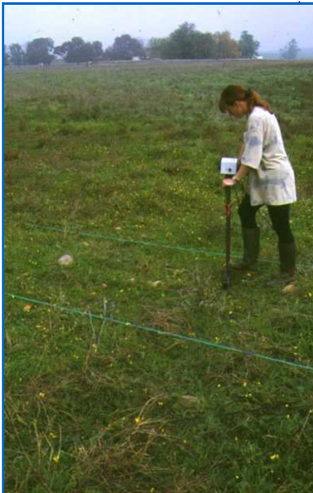
Resistividad en Madinat Azahara (Córdoba) (TERRA NOVA Ltd.)

Existeixen diverses tècniques de prospecció geofísica com són la resistivitat elèctrica, magnetometria, resistivitat electromagnètica, radar o fosfats. Cadascuna d'elles proporciona unes dades concretes sobre els sòls i qualsevol anomalia , arqueològica o no, que es trobi en el subsòl. Tal com es deia al principi, es recomana fer servir el màxim de tècniques possibles en una àrea, ja que cadascuna d'elles proporciona una informació complementària. Al tractar-se d'una tècnica desconeguda per molts arqueòlegs i el gran públic, s'han produït alguns mals usos de la prospecció geofísica en els darrers anys, provocant una certa polèmica. Per això, els organismes nacionals corresponents han definit un codi de conducta pels prospectors per tal d'evitar qualsevol picaresca que es produeixi al seu voltant. Les més exteses actualment són la resistivitat elèctrica, magnetometria i radar, i de les quals parlem a continuació en més detall.