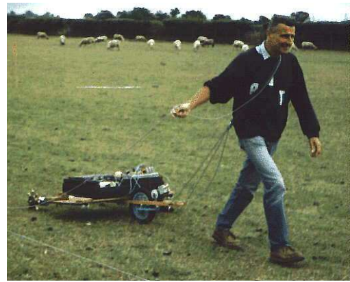
Propector en acció

Si en els països del nostre entorn ja existeix una gran tradició en la utilització d'aquests mètodes, a casa nostra no hi ha quasi equips de prospectors, i la majoria provenen de geologia, amb objectius molt diferents, la qual cosa limita la seva comprensió de la problemàtica arqueològica concreta. Fora bo que la pròpia especialitat desenvolupés els seus grups especialitzats interdisciplinaris d'arqueòlegs i geòlegs, que les Universitats formessin els especialistes dins dels seus Plans d'Estudis i que les Administracions fossin més receptives a l'aplicació d'aquestes tècniques. Tot això són reptes que resten assolir en els propers anys, el primer d'ells és, sens dubte, la difusió d'aquestes aplicacions geofísiques .