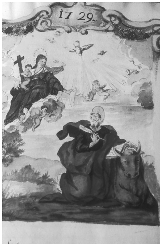
Figura 7. Anònim: Aparició de la Verge a sant Lluç (Llibre dels beneficiats...).