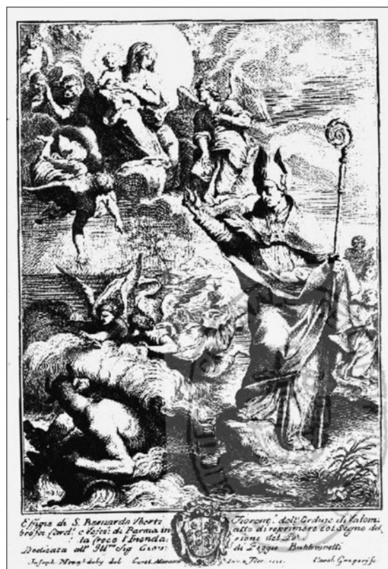
Figura 18. Gravat d'un original de Carlo Maratta: San Bernardo Urberti, cardenal i bisbe de Parma, evitant, amb el signe de la creu, la inundació del Po.

parece haber sido construída tomando por modelo a alguna persona conocida de su tiempo en la ciudad, como parece haber ocurrido con otras del mismo autor que existen en San Lucas.