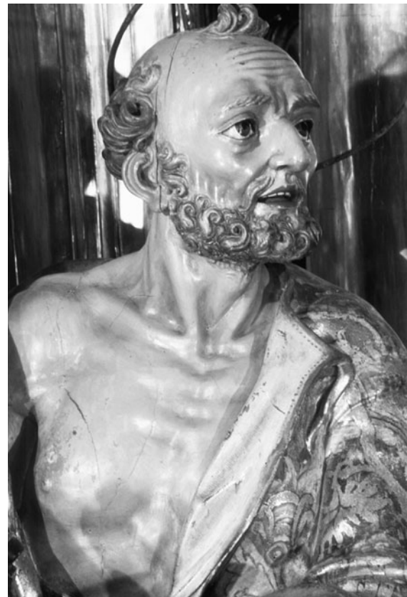
Figura 11. Jacint Morató: Sant Pere (procedent del retaule major de Sant Lluç de Girona).

En la pared opuesta, un magnífico relieve barroco, de grandes proporciones, que representa la aparición de la Sma. Virgen a San Lucas, mientras escribe el Santo Evangelio, obra del siglo XVIII y sin duda la mejor pieza de la