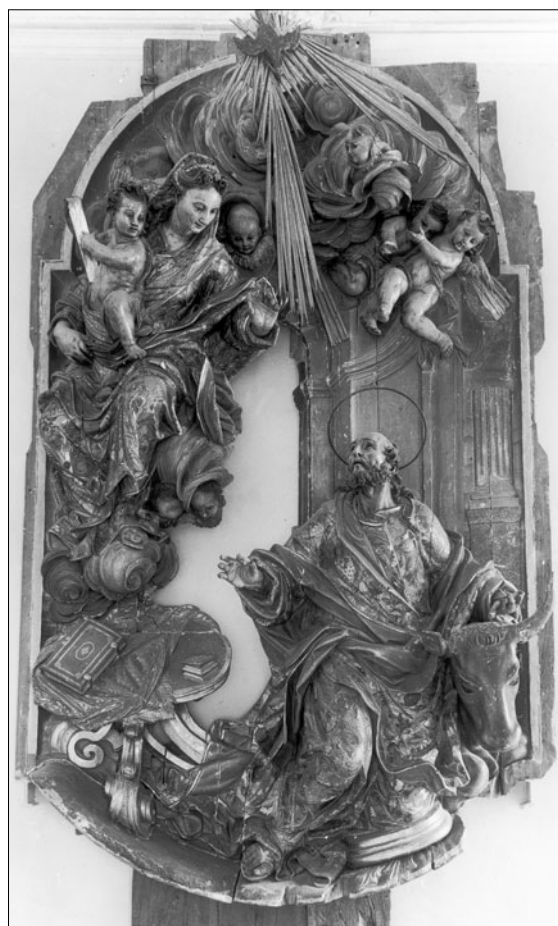
Figura 6. Jacint Morató: L'aparició de la Verge a sant Lluç (relleu central del retaule major de Sant Lluç de Girona).

Hi afegirem que, a l'Arxiu Capitular de Girona, hi hem localitzat un dibuix acolorit, que ocupa poc més de la primera mitja pàgina del