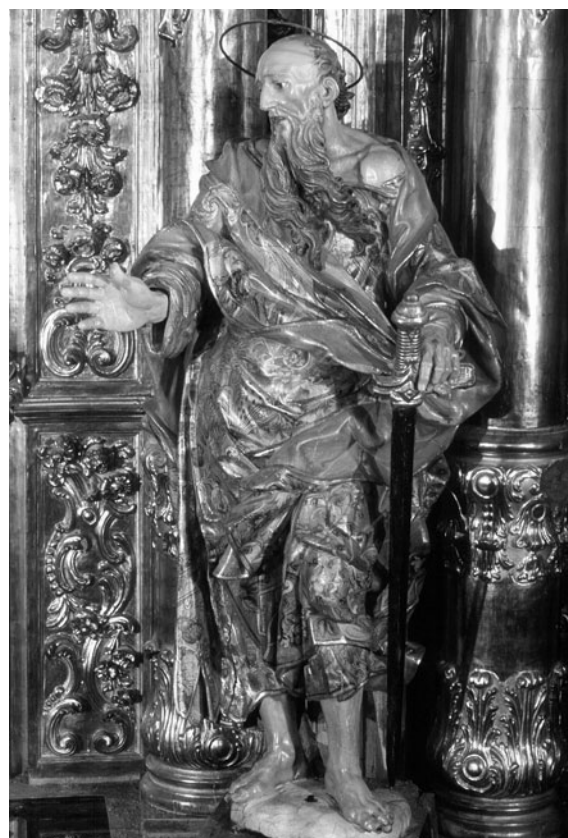
Figura 12. Jacint Morató: Sant Pau (procedent del retaule major de Sant Lluç de Girona).

tal de fusta— i n'ha mostrat un nivell de qualitat ambiciós i exigent —ben manifest al tauló de Sant Lluç. La descoberta del conjunt de peces procedents del retaule de Sant Lluç, el fet d'haver localitzat cinc talles, fins ara inèdites, permeten valorar per primera vegada l'aportació de Jacint Morató en el terreny de l'estatuària, descobrir-lo com un dels escultors més qualificats i ben informats del panorama artístic català contemporani, al nivell de qualitat semblant al de Pau Costa o de Josep Sunyer i Raurell.