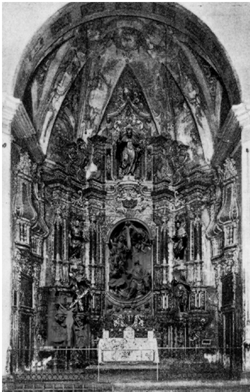
Figura 5. Jacint Morató: Retaule major de Sant Lluç de Girona amb les peces conservades. Fotografia: Pla Cargol (1953). Muntatge: Ferran Port.

El conjunt de retaules de Sant Lluç, inclòs el major, va desaparèixer durant la Guerra Civil espanyola i només disposem d'una fotografia de conjunt publicada per Pla Cargol (figura 5) que ens permet fer un seguit d'apreciacions icono-