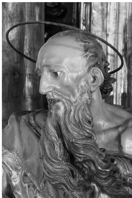
Figura 13. Jacint Morató: Sant Pau (procedent del retaule major de Sant Lluç de Girona).

La qualitat dels sants Pere i Pau és més notable, sobretot si els comparem amb els sants doctors i amb el Sant Narcís. Llurs gestos són més abrandats, més intensos i més apassionats —segurament perquè eren els més propers als fidels. Tenen composicions arriscades i ben interessants: Sant Pere torça el cap mentre eleva la mirada cap a la Verge. La creu escalabornada que duu és una de les més reeixides que s'esculpiren en el barroc català. L'any 1704, Lluís Ribera esculpí un sant Pere d'iconografia martirial per presidir el retaule major de l'església parroquial de Corbera, a la regió nord-catalana del Conflent. Però ni aquest sant té la força de l'apòstol gironí ni la fusta té els nusos i l'escorça treballada com la de la creu gironina. De fet, ja és original l'opció iconogràfica