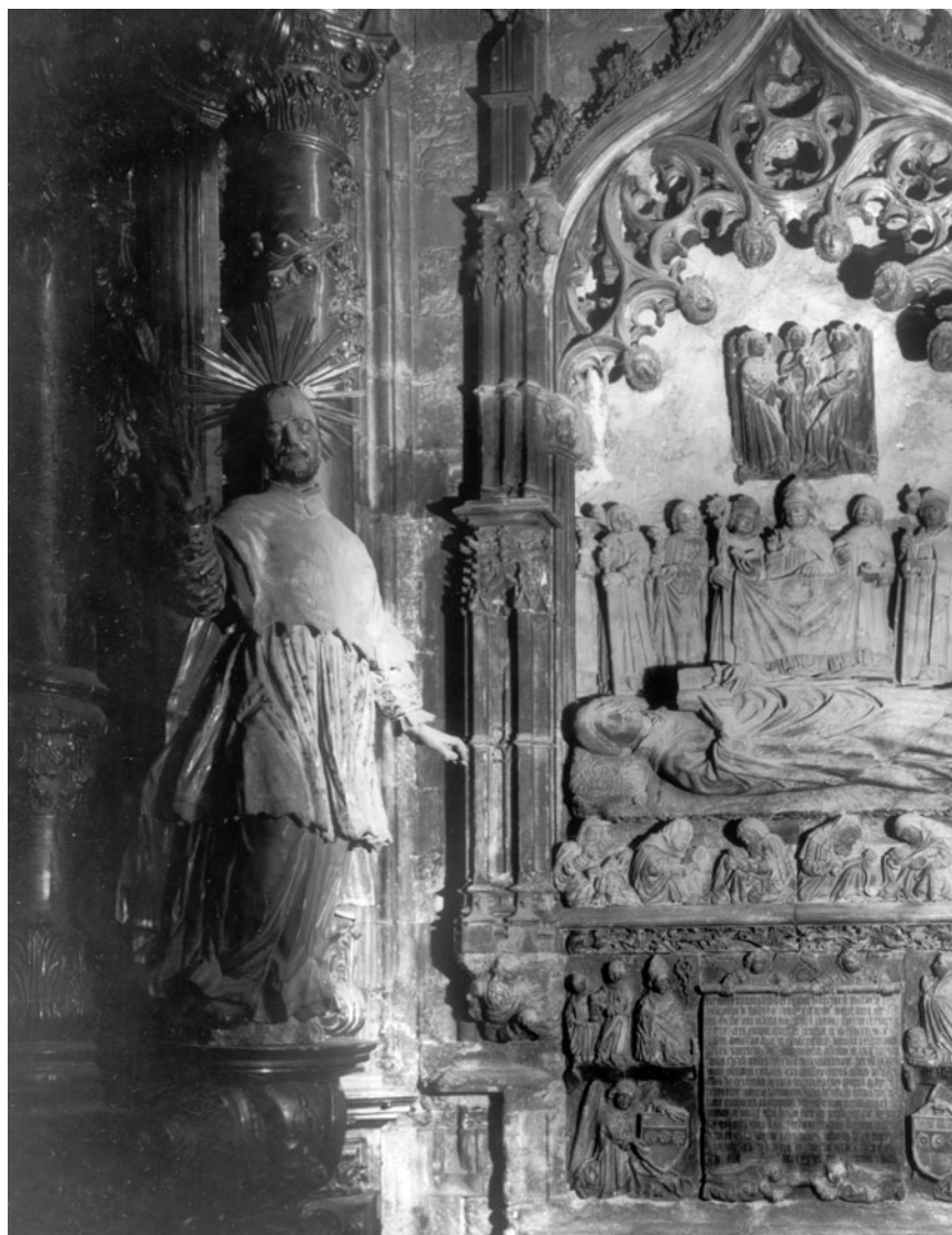
Figura 10. Anònim: Detall del retaule de Sant Isidor de la catedral de Girona.

D'aquesta informació, se'n desprèn que del retaule de Sant Isidor, d'autoria anònima i finançat pel canonge Isidor d'Orteu, entorn de 1780, desaparegueren, durant la Guerra Civil espanyola, l'escultura del sant titular i les dues emplaçades entre les columnes laterals. En aquests intercolumnis buidats, els canonges hi varen muntar les talles dels apòstols Pere i Pau procedents del retaule major de Sant Lluç —en una cronologia incerta que, tanmateix, situem entre 1940 i 1960. Però abans de saber-ho, d'estar segurs que les escultures dels sants Pere i Pau procedien de l'església dels beneficiats i tenint en compte que a la catedral de Girona hi hagué un retaule del segle XVIII dedicat als sants Pere i Pau relacionat amb els escultors Pau Costa i Pere Costa, durant algun temps vàrem estar temptats de considerar que aquest conjunt era el que hi havia muntat a la