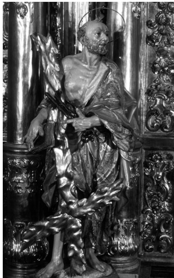
Figura 9. Jacint Morató: Sant Pere (procedent del retaule major de Sant Lluç de Girona).

Però la valoració de Jacint Morató, en general, i del retaule major de Sant Lluç, en particular, no només depèn de l'obra explicada fins aquí. De fet, el seu catàleg d'obra conservada s'ha pogut ampliar en base als «efectes col·laterals» provocats per