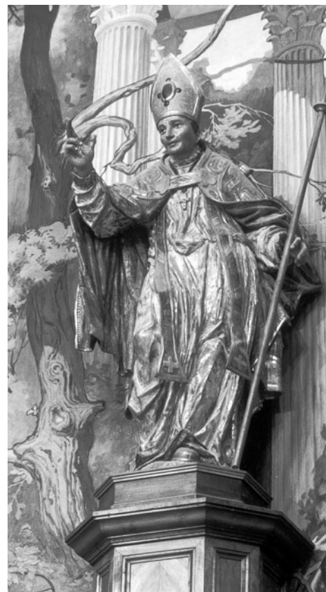
Figura 14. Jacint Morató: Sant Felip Neri (procedent del retaule major de Sant Lluç de Girona).