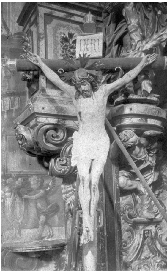
Figura 8. Jacint Morató: sòcol del retaule major de Sant Lluç de Girona.

69. ACG, actes capitulars (1936-1940), «Inventario de las pérdidas