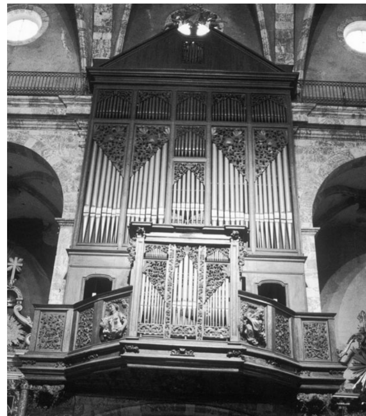
Figura 1. Jacint Morató: Orgue de l'església parroquial d'Illa de Tet.