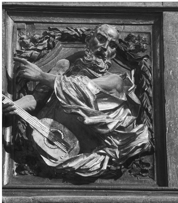
Figura 2. Jacint Morató: Detall de l'orgue de l'església parroquial d'Illa de Tet.