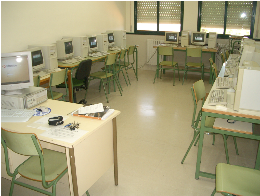
Aula Software Libre I.E.S. Fernando de Mena

creo que podréis configurar un aula de manera sencilla 3 . El manual lo podéis descargar de la página del Centro de Profesores y Recursos de Tomelloso, al que el IES Fernando de Mena está adscrito, en su apartado Asesores – Tecnologías de la Información (I). ( http://www.cprtomelloso.net ). El manual os indicará, además, dónde podéis encontrar información adicional sobre este apasionante proyecto. Además, aprovecho la oportunidad que se me brinda en este artículo para invitaros a todos los interesados a intercambiar dudas, opiniones e ideas conmigo en pro de aumentar la eficiencia de los equipos informáticos en las escuelas.